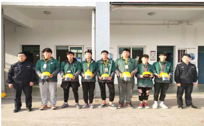
交警大队来校赠送头盔及现场传教