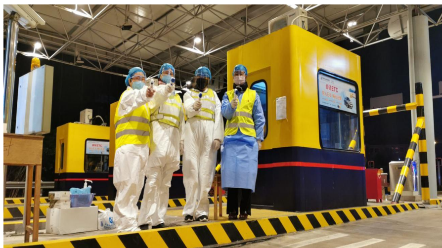
受助学生 参加当地防疫 志愿服务