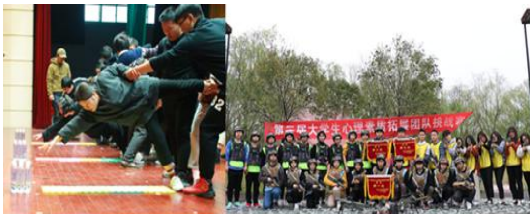
心理素质拓展团队挑战赛