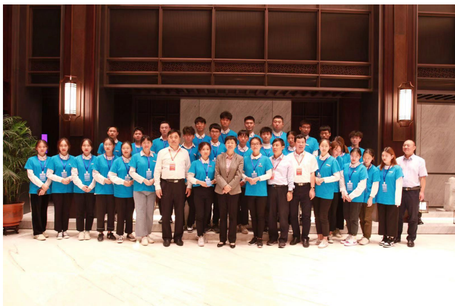
全国供销总社王侠书记、浙江省供销社邵峰书记与学生志愿者合影

以志愿者之校建设为抓手，开展德育教育，增强大学生社会责任感。全年共开展志愿服务活动 57 项 100 多场次，4000 余人次参与，累计服务时数达 3 万余小时，另有 900 人次参与无偿献血。派出千余人次师生开展疫情防控志愿服务、城市道路引导、医院导诊等志愿服务活动。在全国高职院校学生素质教育研讨会上，我院志愿者之校建设工作在会上作了典型经验交流。在全国供销合作社服务乡村振兴暨综合改革专项试点总结交流会志愿服务中，我院志愿者的良好素质得到全国供销总社王侠书记等领导的充分肯定。