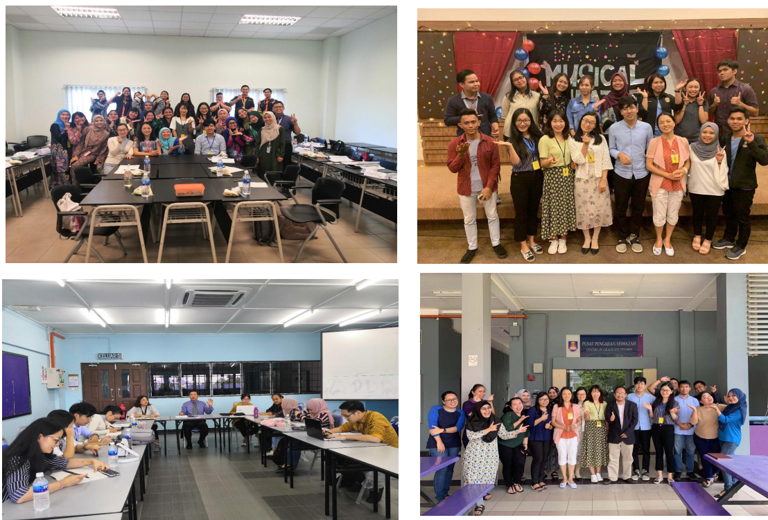
教师在国外访学交流

计划等培训计划，形成了层次分明、梯度成长的梯队结构建设体系。积极为专业带头人发展提供平台，签订双向目标责任书，给予必要的经费资助，鼓励专业带头人带头研究、带头实践，不断发挥专业带头人示范、引领作用。加大中青年骨干教师的培养力度，优先安排国(境)外访问、研修，培养其国际意识和专业开发能力。建立完善青年教师导师制，着力发挥导师的业务“传帮带”作用，为8名青年教师指定了指导教师进行助教培养。本学年尽管受到疫情的影响，想尽办法积极选派教师参加各级各类培训。近650人次参加国内各级各类进修培训项目，公费派出近20人次赴澳大利亚、马来西亚等地进行访学交流，1人参加访问工程师项目。