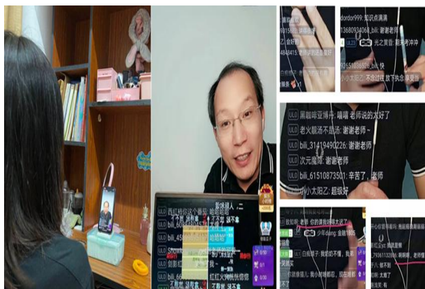
疫情背景下线上直播讲座

2. 心理健康教育扎实开展。以“制度建设、咨询服务、宣传引导、危机干预”为抓手，切实加强心理健康教育标准化建设。通过心理健康宣讲团、心理宣传月、心理科普活动等载体和形式，加强心理健康教育宣传，进一步宣传普及心理健康知识。开展新生心理普测，每月组织学生开展心理研判，分层分类做好心理问题学生咨询服务工作，加强重点学生跟踪回访。疫情期间开通线上心理援助热线，开展线上心理直播讲座，学生返校后，两周内，组织开展全体学生心理健康状况摸排，并建立一人一档。一年来，累计接待心理咨询450余人次，组织精神科专家会诊20余人次，指导系开展重点关注学生危机干预20余次。