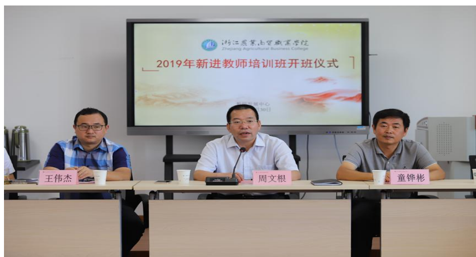
新进教师岗前培训

紧跟国家高等职业教育发展趋势，坚持人才强校战略，遵循“四有”教师标准，以开展形式多样、需求导向、特色鲜明的培训活动为抓手，注重培养教职工的职业道德和爱岗敬业精神，提升教师专业素养能力。健全教师职业生涯培养培训体系，基于教师递进式教师职业生涯发展路径，采用集中培训与分散培训相结合、系统培训与专项培训相结合、线下培训与网络培训相结合、理论培训与实践培训相结合等多种培训模式，为教师提供具有覆盖面广、切入点准的培训服务。一年来学院围绕师德师风、教学方法、教学设计、教学能力、教学创新团队建设等主题开展系列培训，覆盖全体教师，形成点面结合、层次清晰、全阶段多层次教师培训培养体系。通过培训，教师教学能力有效提升。