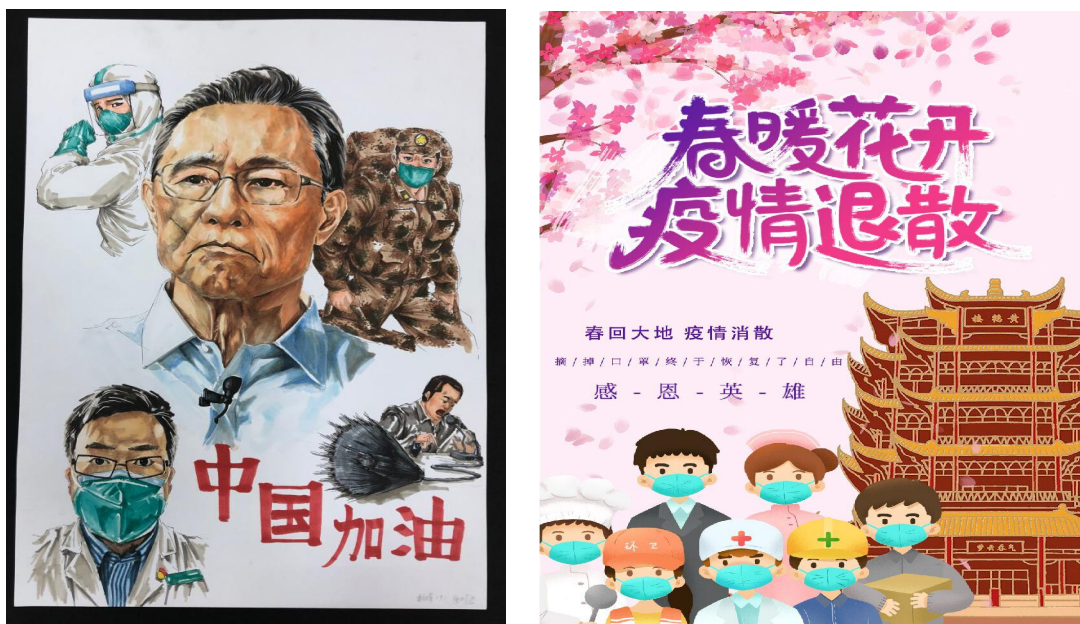
图5 抗疫点赞线上书画艺术比赛部分作品