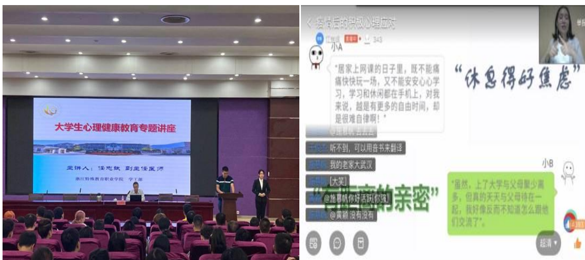
图8 开展线上线下心理健康专题讲座

需要，解决学生实际困难，启动“一站式服务”——学生事务服务大厅，服务大厅内共设立院办、学工部、教务处、总务处、资源中心等5个职能部门窗口，为学生提供集事务办理、咨询服务、交流育人于一体的综合服务。为保障学生假期离校返乡安全便捷，提供“爱心巴士”，为300余名学生返乡保驾护航。建立寝室——班级——系部——学院的四级心理危机干预体系，开展心理健康专题讲座和心理义诊，帮扶心理困难学生，特别是疫情期间开通疫情心理健康热线，积极普及疫情期间心理保健知识。