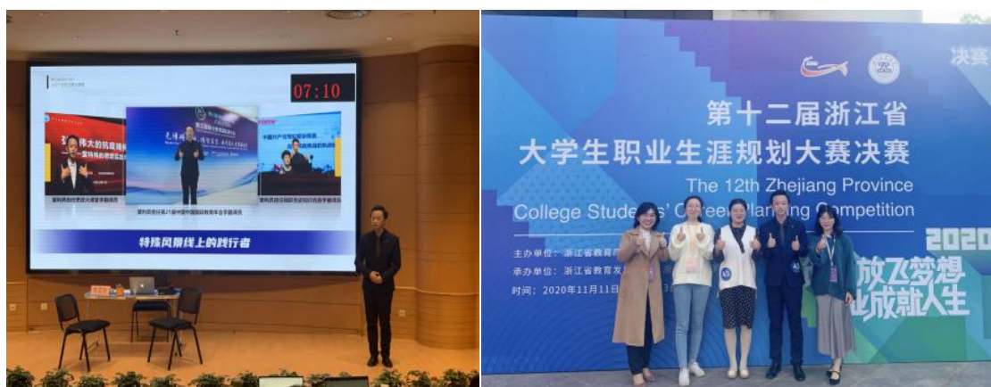
图 10 第十二届浙江省大学生职业生涯规划大赛决赛

学院关注学生职业发展，不断完善就业创业课程体系建设，“以赛促教”“以赛促学”，不断提高学生职业规划指导能力和就业创业指导质量。2020年，学院建立“生涯工作坊”，以在线直播“云指导”形式，开展线上就业课程，提升残疾毕业生的就业技能。邀请杰出校友开讲职前礼仪培训、聋人如何适应社会等，帮助学生了解就业程序，提升就业技能。组织学生参加第十二届浙江省大学生职业生涯规划大赛获得一等奖1项，三等奖1项；承办首届浙江省残疾人大学生职业生涯规划比赛，拓宽了创新创业与职业发展的视野与眼界。