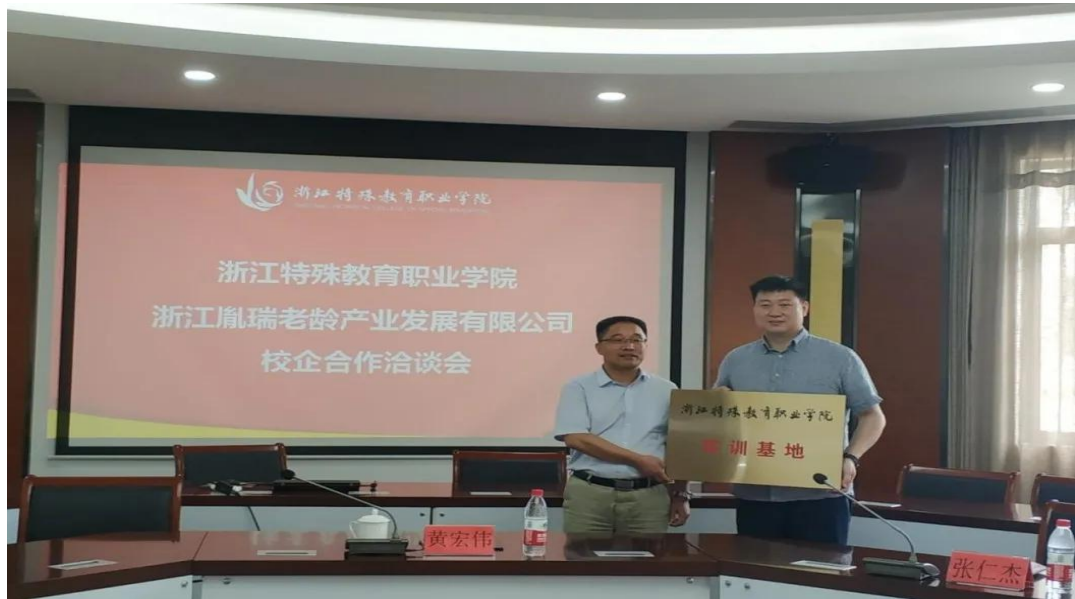
图 14 共建校企合作实训基地