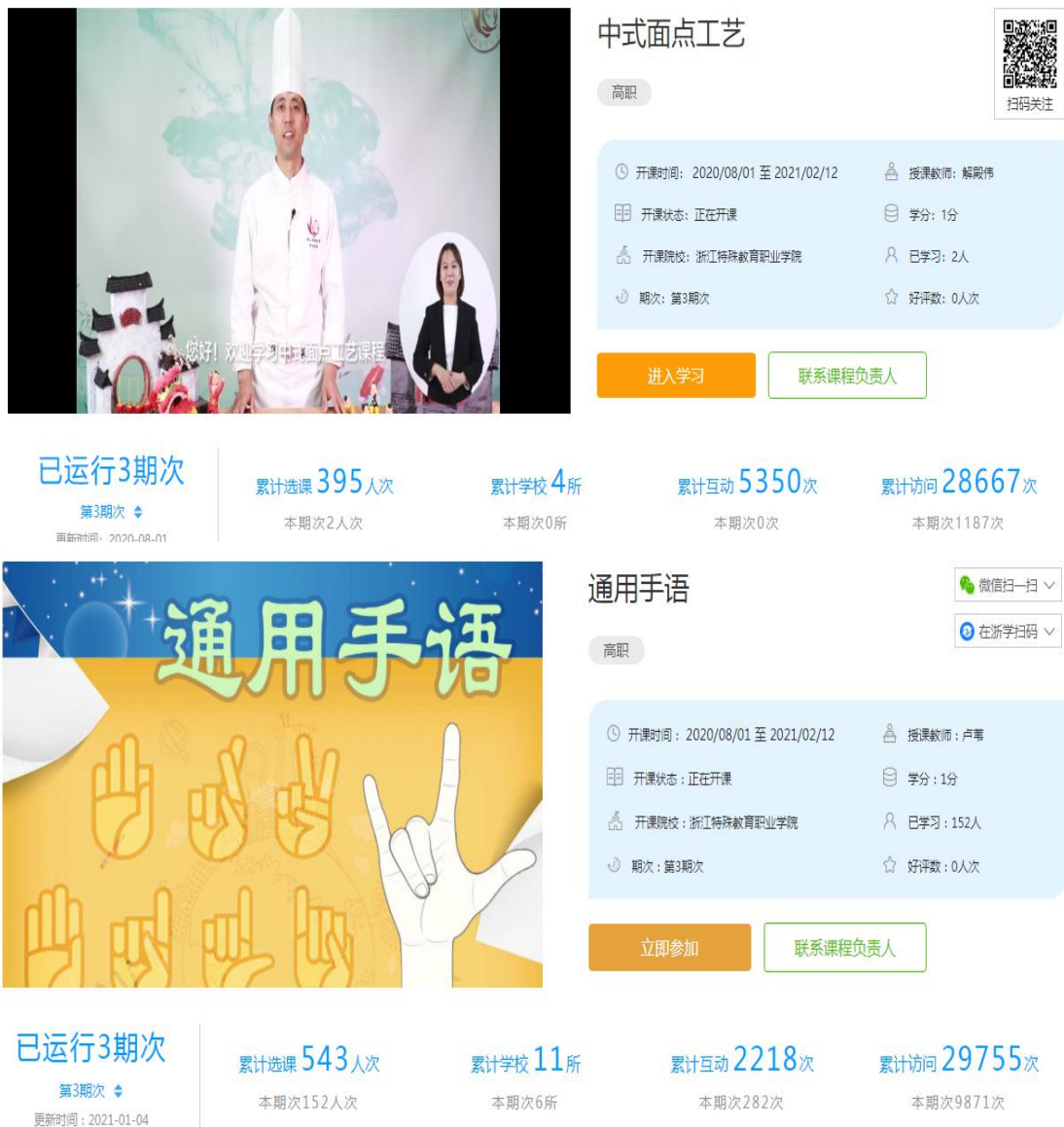
图 13 浙江省精品在线开放课程建设项目