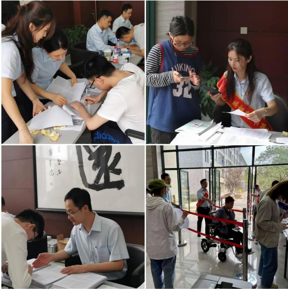
图 17 建设银行西湖支行上门服务学生办理银行卡