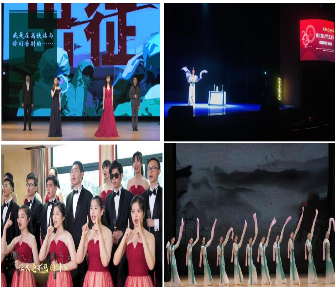
图 6 我校学生参加浙江省大学生艺术节展演

领导小组，制定工作计划，根据疫情防控的实际，开展了以“共克时艰·线上风采”为主题的线上艺术节系列活动，包括“爱我中华文化经典诵读大赛”、“为抗疫英雄点赞艺术设计作品大赛”等活动。充分利用网上平台，鼓励在校学生参与此次大学生艺术节活动，并把爱国热情与抗疫精神相结合，强化了学生的爱党、爱国、爱校意识，同时将艺术教育融入校园文化，用艺术的美塑造美的灵魂，点燃学生对真善美的追求和向往，也充分展现了我校不同类别学生积极向上、团结奋进的青春风采。