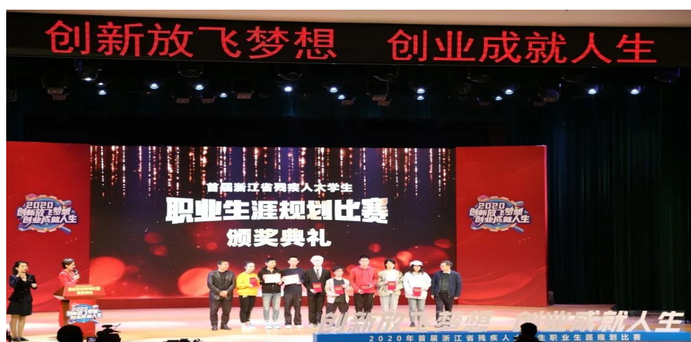
图 11 首届浙江省残疾大学生职业生涯规划比赛

近年来，我院一直重视残疾大学生的职业生涯规划教育，通过“以赛促学、以赛促改、以赛促建”，切实加强残疾人大学生职业规划课程的建设，提升残疾人大学生自我认知，树立正确的择业观、就业观，用奋斗成就青春之我。本次比赛颁奖典礼通过央视新闻移动网、中国残疾人就业创业网络服务平台、浙样红 TV 微博进行全媒体直播，扩大了学院社会知名度。