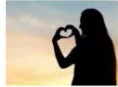
图 21 其他公众号转发