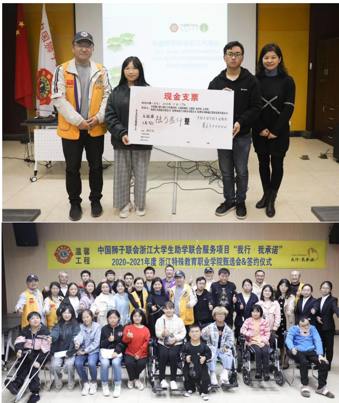
图7 与中国狮子联合会浙江代表处签约

启动专项补贴，精准帮扶。 启动新疆籍家庭经济困难学生专项补助，总计11人，资助金额2750元。对接缙云县籍残联，对2019级缙云县残疾大学生进行专项补助，每人专项补贴2000元。资助暖心护航新生开学，为29名低保家庭新生发放新生爱心床上用品，32名学生办理生源地助学贷款。