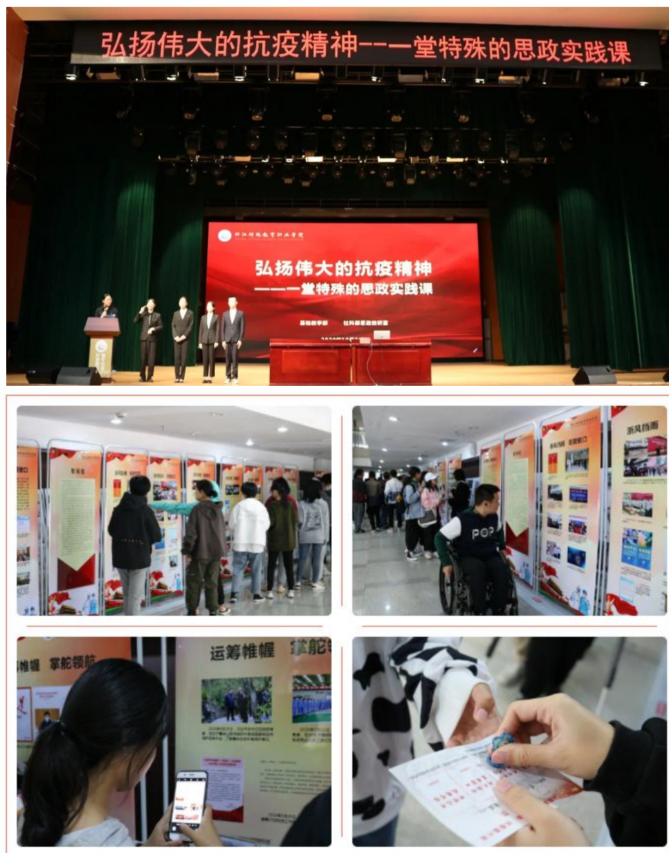
图2 思政实践课图片展等

大型纪录片展播、援鄂医生专题讲座等环节，我国波澜壮阔的抗疫历程、全国人民同心铸就的伟大抗疫精神、疫情期间驰援武汉医护人员的亲身经历都成为了最厚重、最鲜活的思政课教材。