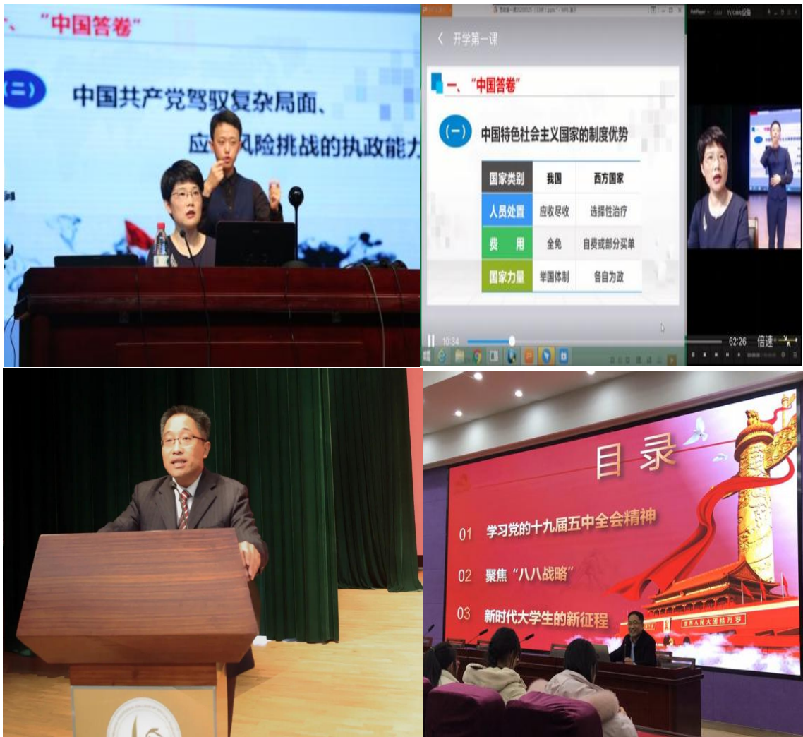
图 1 开学第一课