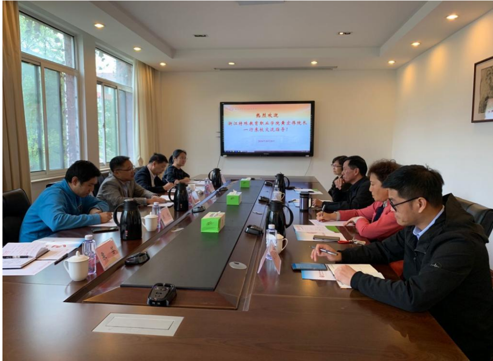
图 18 赴兄弟院校考察交流

校际联合开展“3+2”人才培养。2020年，学院与浙江省盲校达成校校合作共识，深入对接“3+2”中高职合作，联合创新共育人才，提升盲人就业层次。与浙江科技学院开展“3+2”高本衔接，联合培养视觉传达设计专业本科学生，搭建人才培养立交桥，打通学生学习上升通道。