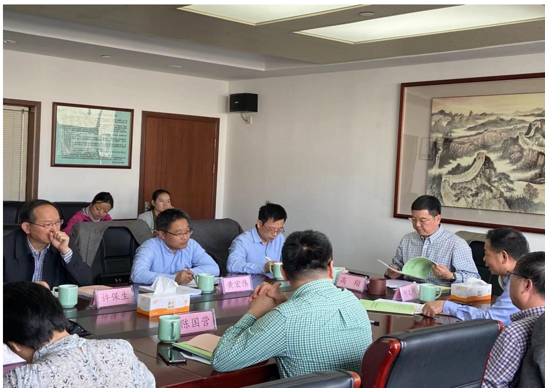
图 19 浙江省残疾人事业“十四五”规划基础课题项目结题评审现场

2019年学院获得浙江省残疾人联合会党组研究确定的浙江省残疾人事业“十四五”规划基础课题项目。经过一年的研究，《“十四五”残疾人社会保障与公共服务体系建设研究》《“十四五”残疾人精神文化体育生活与社会助残研究》《“十四五”浙江残疾人法制建设、组织建设与权益保障研究》《“十四五”浙江残疾人共享现代化研究》等4个子课题均顺利结题，该项工作成效受到省残联主要领导的充分肯定。学院作为特殊高等职业院校的“智库”作用逐渐彰显。