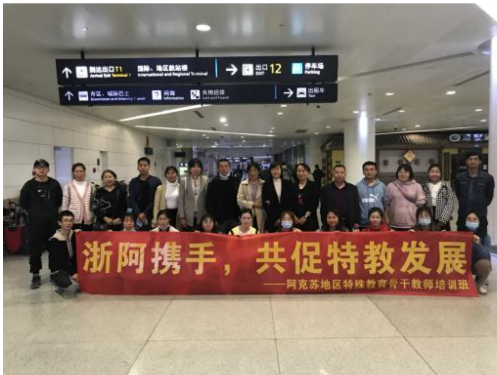
图 20 阿克苏地区特殊教育骨干教师培训

手语翻译、非遗传承、康养结合等三个社会服务工作团队，从“受助”到“育助”、“送助”，主动服务、深入参与，着力打造具有鲜明特色和较强社会影响的志愿服务品牌。康复治疗技术（老年和残疾人康复方）专业参与湖州、嘉兴、丽水、温州四地的“残疾人之家”星级评定工作，特殊教育（手语翻译方向）专业浙江经视合作录制通用手语推广教学视频，疫情期间为聋人录制抗疫视频并被省外残联单位转载。