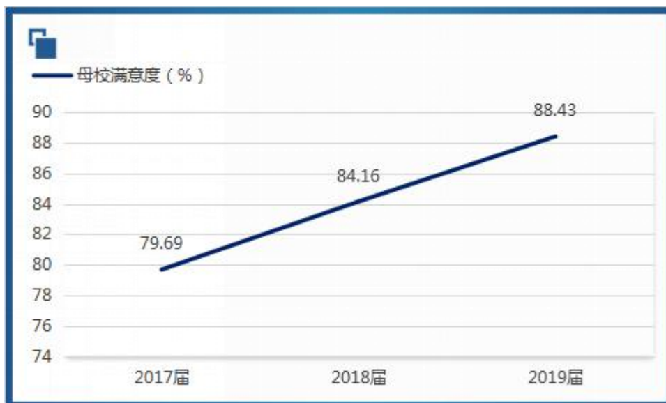
图 2-3 2017-2019 届我院毕业生对母校的满意度