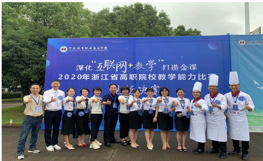
图 16 2020 年浙江省高职院校教学能力比赛参赛团队

2020年，成立教师发展中心，全方位、多路径、分层次推进教师发展工作。积极组织教师参加“全国职业院校教师信息化教学能力提升培训项目线上培训”、职业院校“‘三教’改革背景下教师教学创新团队综合能力提升高研班”等，以提高教师教学能力。在2020年浙江省高职院校教学能力比赛中，获得一等奖1项、二等奖3项、三等奖1项，在浙江省49所高职院校中排名第6位，教师教学技能比赛创历史最好成绩。