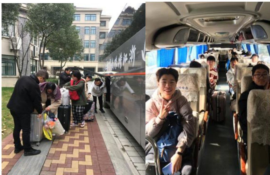
图9 “爱心巴士”送学生温暖回家

余名学生，为学生返乡保驾护航。今后，学院将此爱心项目固定化、常态化，让“温暖回家路”成为特教学院的一张靓丽名片，为更多的学生提供更优质的服务。