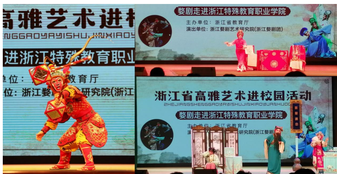
图4 国际残疾人日高雅艺术进校园婺剧折子戏

学院以创建“博爱自强”校园文化品牌为引领，培育和传播残健融合文化，发挥校园文化的育人价值，持续推进“学生综合素质培养工程”和“爱心助校工程”。学院结合“全国助残日”、“国际残疾人日”、“国际盲人节”、“国际聋人节”等残疾人节日，举办高雅艺术进校园婺剧折子戏专场演出、杭州国际音乐节公益普及演出、“世间有爱·不再黑暗”庆祝盲人节主题活动、无障碍电影观影活动、“白手杖”交流座谈等活动，关爱残疾学生。开展线上校园文化艺术节“为抗疫点赞线上书画艺术比赛”，收到来自工艺美术品设计、电子商务、中西面点工艺、数字媒体艺术设计四个专业的包括书法、绘画、电子海报、视频制作、团扇等各类作品共计90余件。