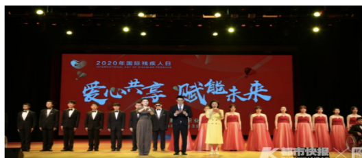
图 15 “爱心共享 赋能未来” 2020 年国际残疾人日活动引主流媒体关注

12月3日，第二十九个国际残疾人日，“爱心共享 赋能未来”浙江特殊教育职业学院2020年国际残疾人日活动在学校举行，在这个特殊的日子，来各行各业的企事业单位为广大学子送来了实实在在的爱心大礼包，或捐赠设备、或捐赠教育基金，用不同的方式助力特殊教育。