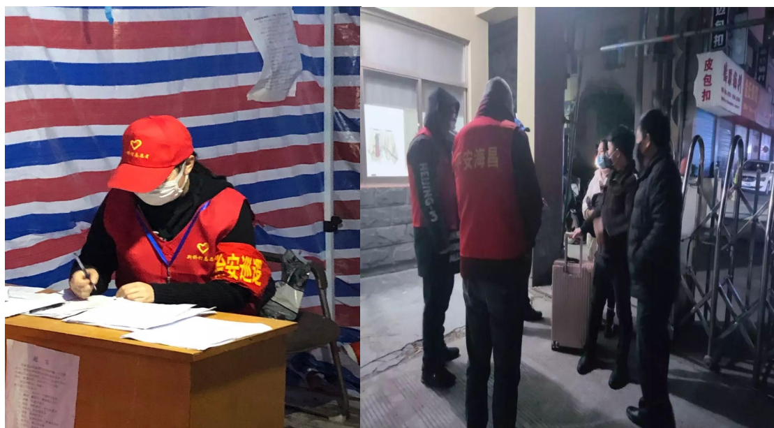
图3 我院学生参与抗疫志愿服务

2020年，疫情防控期间，学院积极号召学生积极投身防疫青年志愿服务工作。54名特教学子在防护措施到位的情况下，积极参加属地的志愿服务工作，开展体温测量、人员排摸、宣传引导、便民服务、物资管理等工作，以切实发挥青年突击队的作用。组织各专业学生运用自己的专业特长进行“抗击疫情，我们在行动”主题作品创作，以书法、文字、海报、绘画、摄影、面点制作等多种形式结合学院特色，创作出系列以抗疫为主题的正能量优秀作品100余件，展现疫情面前特教学子的担当与行动。