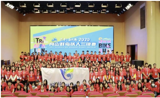
舟山群岛铁人三项赛志愿者