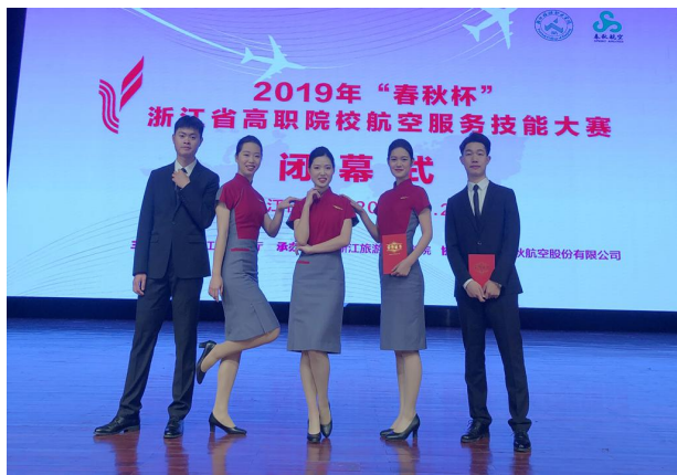
2019年“春秋杯”浙江省高职院校航空服务技能大赛