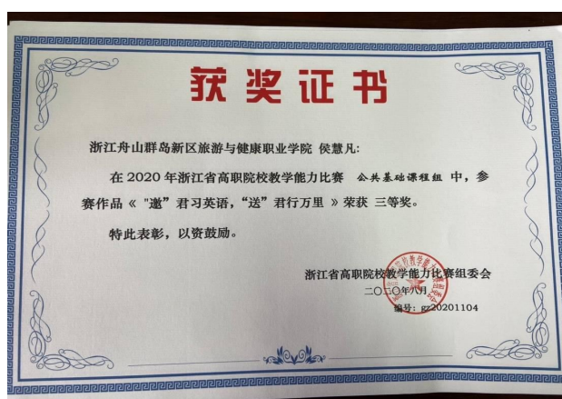
2020年浙江省高职院校教学能力比赛三等奖