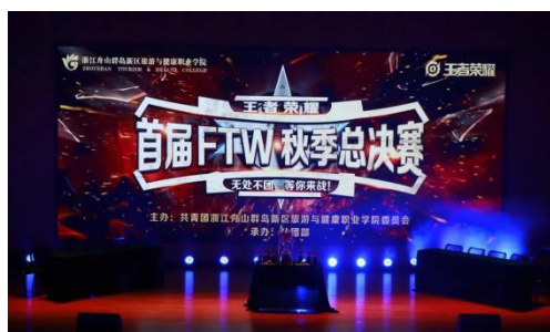
社团文化节电子竞技大赛

依托节文化塑造工程，不断推进校园文化艺术的蓬勃发展，校园文化建设打开新局面。2020年的社团文化节努力拓宽校园文化新渠道，开创了电子竞技大赛，该赛事匠心独具，符合时代特征、青年特点，打造互联网+时代大学生活动新格局。