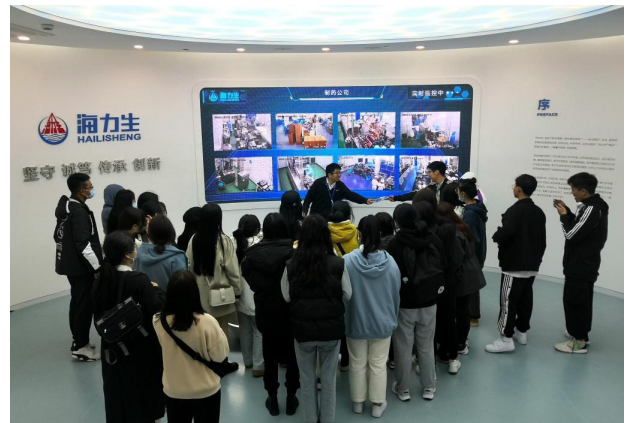
商学院新生研讨课走进海力生集团 2