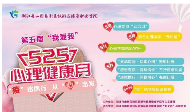
第五届心理健康月系列活动

学校心理协会成立一年以来，通过微信公众号、心理健康月系列活动等形式普及心理知识，帮助同学提升心理素质，建立健全人格。同时，协助学校心理咨询中心提供心理咨询服务，直接或间接地进行自助、助人、互助交流。