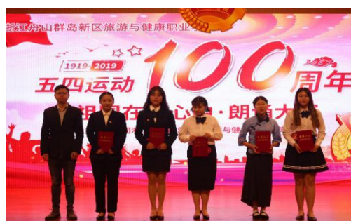
校团委举办“祖国在我心中”朗诵大赛

全校团员积极参与舟山市创建文明城市建设。学校团委大力开展形式多样的创城志愿服务工作，三年来，志愿汇平台上因创城志愿工作注册签到 3996 人，充实了庞大的创城志愿者队伍。志愿者们进景区、上码头，积极做好环境卫生净化、河道清理、文明行为引导等，做到了全校师生人人参与创城，人人都是志愿者。在微信公众平台上发出“助力创城，人人有责”和“党旗所引团旗所向，净化校园师生同行动”等号召，全校 59 个团支部两千余人积极参与创建文明城市。在 2020 年的暑期社会实践活动中，学校组织了一支优质学生干部队伍，协助普陀山-朱家尖管委会旅游局做游客咨询服务工作，该项志愿服务以题为“景区红马甲，真美”登载在 6 月 27 日《舟山晚报》。