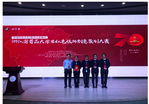
浙江省首届大学生红色旅游创意策划大赛