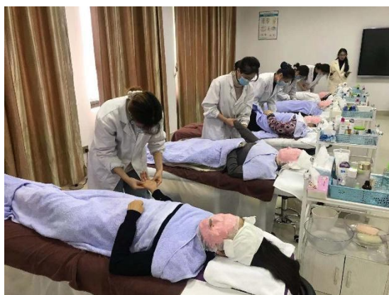
2020 年秋季护理（医疗美容）专业技能比赛

学校积极推进 1+X 证书试点工作。在 2019-2020 学年推进开展 3 个试点工作，分别为失智老年人照护职业技能等级证书、财务共享职业技能等级证书试点和研学旅行策划与管理（EPEM）职业技能等级证书试点。学校将 1+X 证书培训内容及要求，有机融入各专业人才培养方案和教学体系中，优化课程设置和教学内容，完善专业人才培养方案与课程体系。如导游专业教研室将核心课程增设了《研学旅行实务》课程，专业实训课增设了《1+X 证书职业技能实训》课程，专业选修课程增设了《研学旅行课程设计》、《旅活动策划与实务》等课程。护理专业教研室对于已有的老年方向专业模块课程——《老年护理》、《老年照护技术》、《失能老年人护理》进行授课内容改革，增加其中有关失智老年人照护的课程内容并增加相应课时安排。会计专业教研室对财务共享服务职业技能等级证书相关的课程进行了整合，《纳税实务》课程需将税务申报作为重点进行实训讲解，《经济法基础》课程将重点讲解银行存款账户管理。