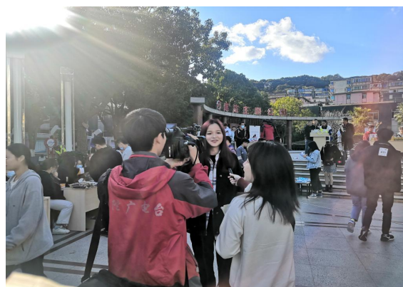
首届沈家门渔港·普陀水产综合体 “兴普创业杯”双十一直播