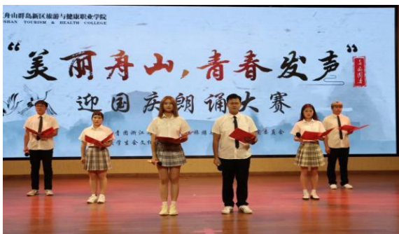
“美丽舟山 青春发声”迎国庆朗诵大赛

在重大节庆日里开展了一系列读书征文、演讲辩论、论坛讲座等有关理想信念的主题教育活动，从2017年的“读习语”到2020年的“我们都是收信人”“习总书记给北京大学援鄂医疗队全体90后党员回信”精神、“习近平总书记考察浙江讲话精神”、“习近平与大学生朋友们”等系列学习。