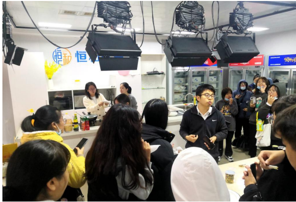
商学院新生研讨课走进海力生集团 1