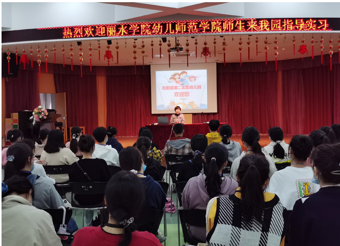
实习生与幼儿园见面会