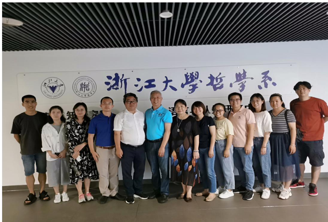
骨干教师浙江大学考察交流

设逐渐规范化、制度化和科学化。充分发挥教研组的研究、指导、培养、服务、管理功能，完善教研活动制度，教研活动做到定时、定点、定内容、定形式、定主题，确保活动落到“校本教研、校本教材建设、课堂教学研究”的实处，提高活动质量。四是强化校本培训。实行专任教师全员培训制度。采取研训结合，分层分类，为教师的专业化发展搭建平台，有效促成教师专业的拓展和转型。五是发挥骨干教师示范引领。一直以来，学校规定高级教师人人开设示范课，中年教师开设优质课，青年教师开设请检课。六是关注青年教师成长。学校确定了新教师“导师制”计划，开展新老教师帮扶结对活动。七是加强师资团队建设。社会服务团队、艺术服务团队、实验室建设团队等，促进校地合作，激励教师专业发展。一年来，有 25 人申报攻读博士学位，54 人已顺利通过高校教师教育理论培训考试，新增副教授 1 人，新秀、新苗 2 人。