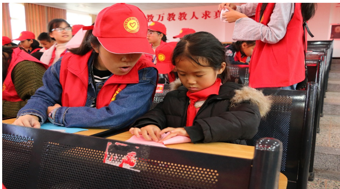
剪影手工社教授手工作品