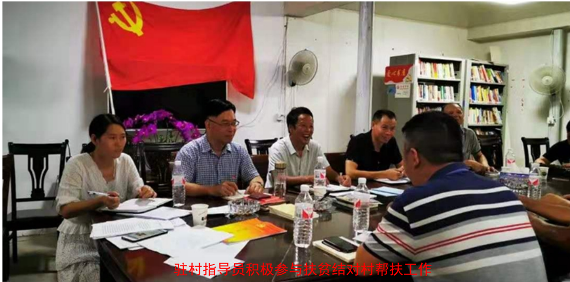
驻村指导员积极参与扶贫结对村帮扶工作