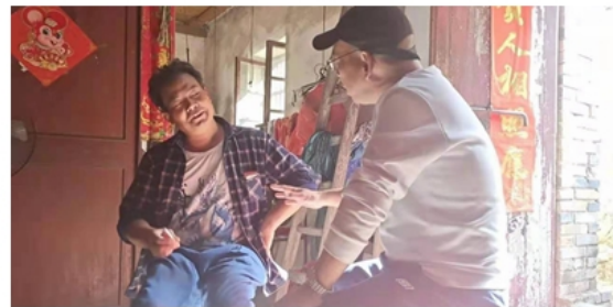
全体党员参加志愿服务活动助力结对村复工复产；驻村指导员深入农户进行调研指导