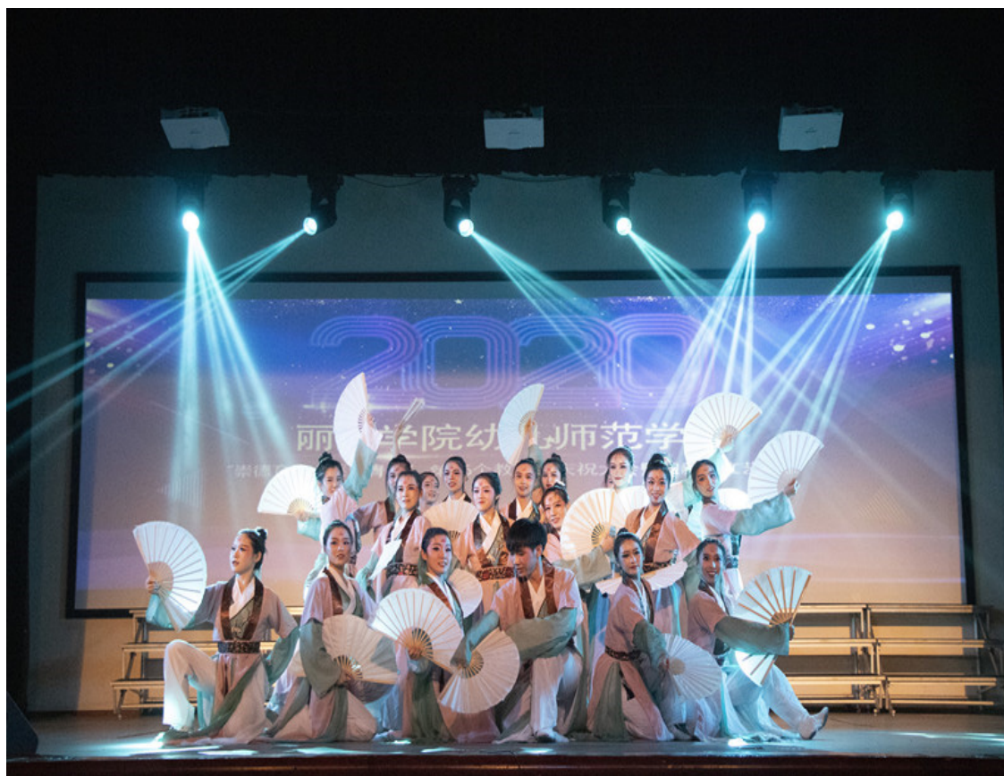
2020年浙江省大学生艺术节中舞蹈类比赛二等奖