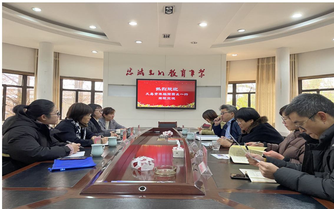
义乌市 4 所幼儿园园长来校对接学生就业、实习工作