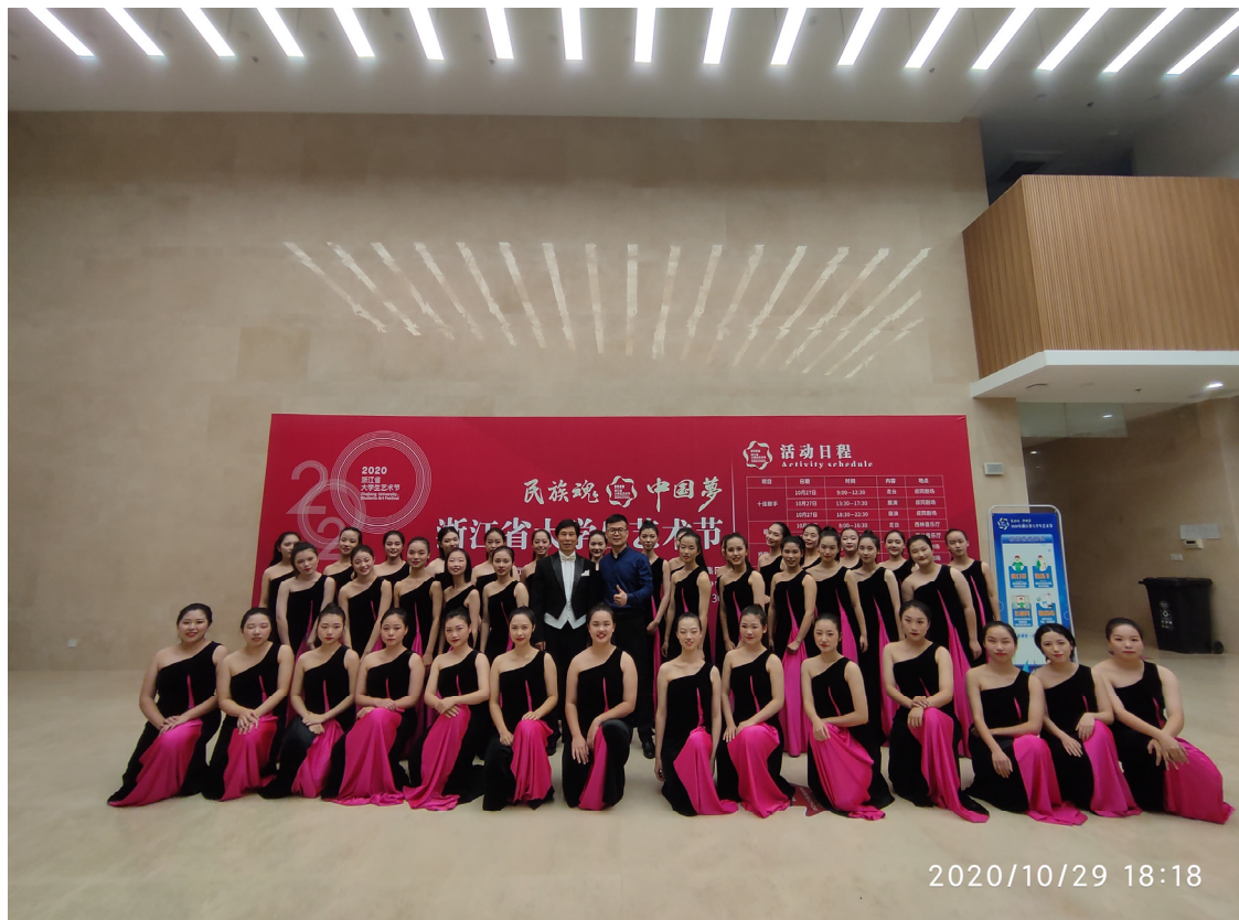
2020年浙江省大学生艺术节中合唱类比赛一等奖