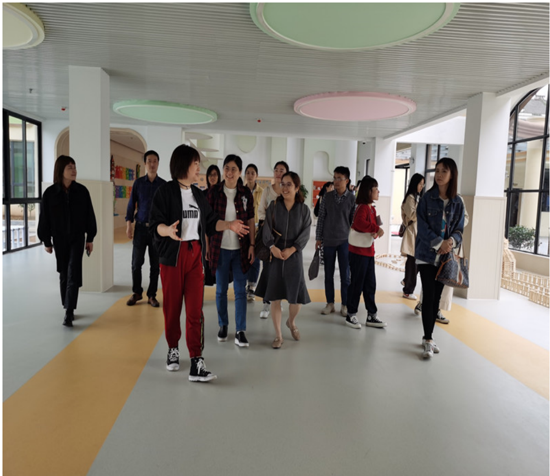
赴云和木玩游戏实践园开展“校·园”联合教研活动

专业队伍赴云和木玩游戏实践园开展“校·园”联合教研活动，进一步加强对云和木玩游戏模式的研究，深化我校与学前教育专业实践基地的合作。应松阳实验幼儿园、松阳县第二实验幼儿园和松阳县闻莺南城幼儿园的邀请，开展了儿童剧场“绘本剧表演”走进幼儿园活动，广受好评。同时，每学期聘请幼儿园教师到学校开展专题讲座、教学活动；派遣专业教师进幼儿园学习和挂职实践。新进教师在第一年需在完成校内工作外，每周需下幼儿园参与幼儿园实践活动，熟悉幼儿园活动的安排与组织，提升教学专业能力；其他专业教师在每学期学生实习过程中，同学生一起进幼儿园挂职实践。实习幼儿园参与学生实习过程的管理和指导。