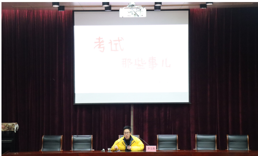
学生考编培训指导

2020 年度，学前教育专业 2017 级中专毕业生人数 188 人，升入高一级学校 187 人，其中五年一贯制升学人数 183 人，另有 4 人其他形式升学。2015 级大专毕业生 269 人，初次就业人数 256 人，就业率 95.17%，专业对口人数 218 人，专业对口率 85.16%，其中 63 位同学考上各地教育局幼儿园编制或报备员额编制，26 位同学通过全日制专升本考试。