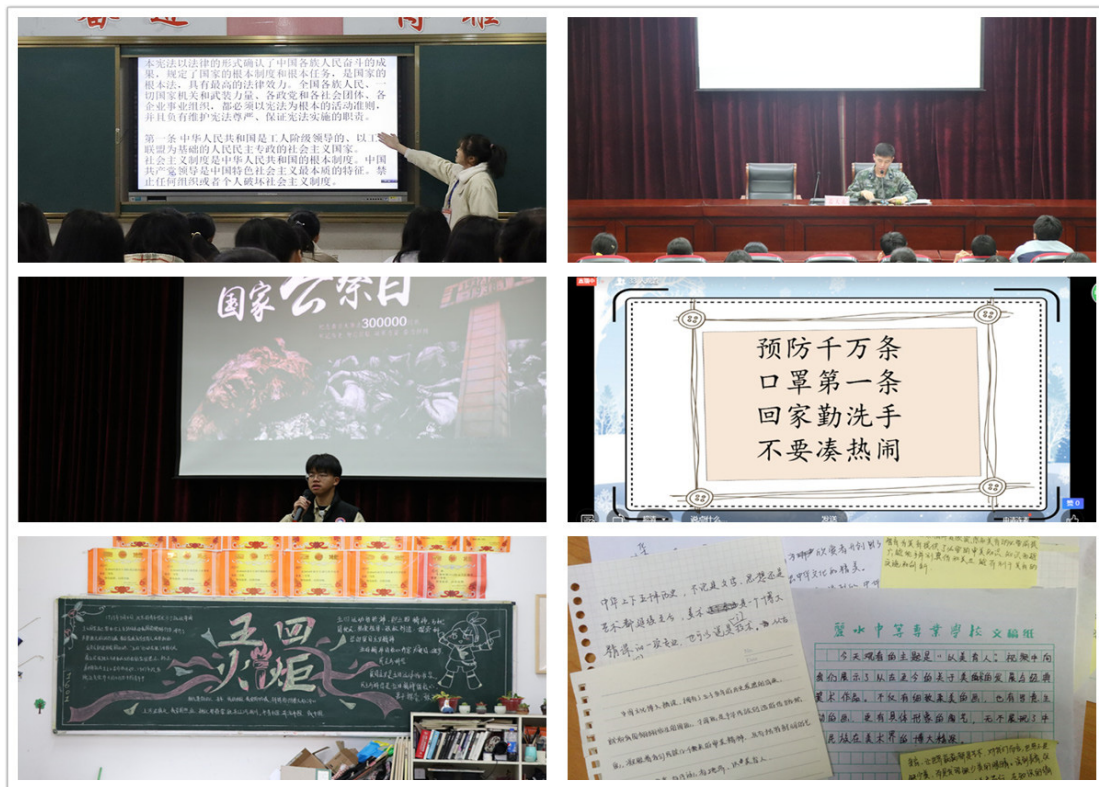
宪法晨读；国防知识讲座、纪念“国家公祭日”演讲比赛；疫情专题网络主题班会、“五四”黑板报评比；学生“美育教育”心得

等主题。设计并开展“同心同行，共击疫情”等主题教育活动，通过国旗下讲话、主题班会、集体群诵、黑板报、征文比赛、短视频制作、书画比赛等形式开展主题系列教育。探索“互联网+”思政，提升教育效果。联合学生处、团委、教学段打造集思想政治教育、信息发布、工作交流、资源共享的应用型微信工作平台。坚持党建引领，筑强理想信念。加强学生党员、入党积极分子的教育管理，进一步规范业余党校教育活动的开展，依托互联网新媒体学习平台延伸党员和入党积极分子教育触角，强化典型示范引领。重视法制教育。组织了“学宪法、讲宪法”校级演讲比赛和知识竞赛，两位同学均获丽水市“学宪法、讲宪法”演讲比赛、知识竞赛一等奖。学生思想政治表现良好，思想健康，政治觉悟高。遵纪守法，爱国爱校，一年里没有发生群体性事件，违法犯罪率为零，家长、社区、用人单位评价良好。