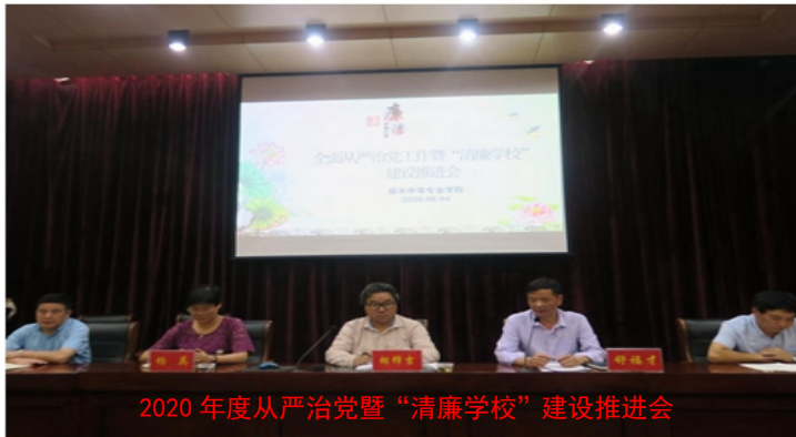
2020年度从严治党暨“清廉学校”建设推进会

行党员的职责，完成党员承诺践诺活动。党建工作经费纳入学校预算，实行党费经费专款专用，合理规划，严格审批，主要用于党建及各项党员活动。2020年开展理论学习20余次，主题党日10次、组织生活会2次、民主生活会2次、党风廉政分析会3次、党课6次。全年共发展11名学生、1名教师为预备党员。