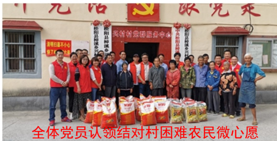
全体党员认领结对村困难农民微心愿