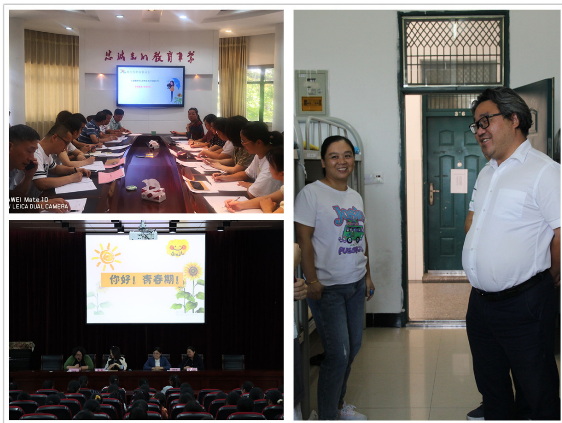
班主任学期集中培训；领导干部下寝室；学生“青春启动”仪式

3.4.3 财务管理。 重视预决算报告的制订，成立财务预决算领导小组，对经费预算合理规范，资金合理使用，凸显资金效益。规范财务管理，先后完善了采购管理制度、预算管理制度、收入管理制度、合同管理制度等制度，实行财务制度公开，根据学校奖金发放制度规范发放，严格执行学生学费、住宿费、代收费标准。进一步完善固定资产管理系统和校产管理制度，明确校产管理人员，责任落实到人。严格执行采购制度，成立大宗物品采购招标领导小组，执行采购审批程序，提高财产使用率。根据校安工程管理规定，完成了学校基本建设，确保教学场所正常投入使用。做好教育教学设备投入，不断改善办学条。多形式开展节约型校园活动，提高师生的节约意识。