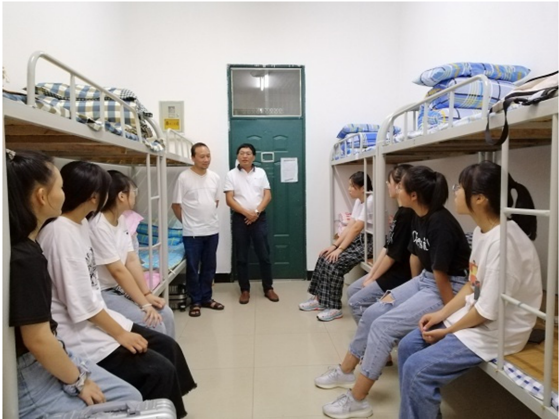
领导干部结对班级全员下班下寝

3.4.8 管理信息化水平。 为增强学校信息化工作的推进力度，学校建立健全教育信息化工作的管理机制，成立了由校长为组长，学校中层领导以及技术骨干为组员的工作领导小组。学校设立了信息技术中心，配备专职人员分工负责管理学校的现代教育技术工作、信息技术教育、校园网络网站建设等工作，全面推进学校现代教育技术工作。2020年，立足学校智慧校园及教育信息化建设需求，完成了电子阅览室的升级改造工作。在管理信息化方面积极响应政府号召，立足学校实际完善了了浙政钉各项后台建设，实现了公文流转，智能化考勤，教职工出差请假、物资采购、学生请假等线上审批，实现了无纸化办公。