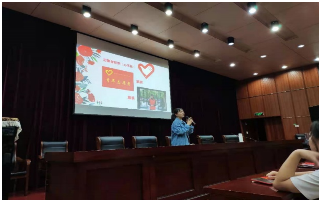
团干部主题团日活动