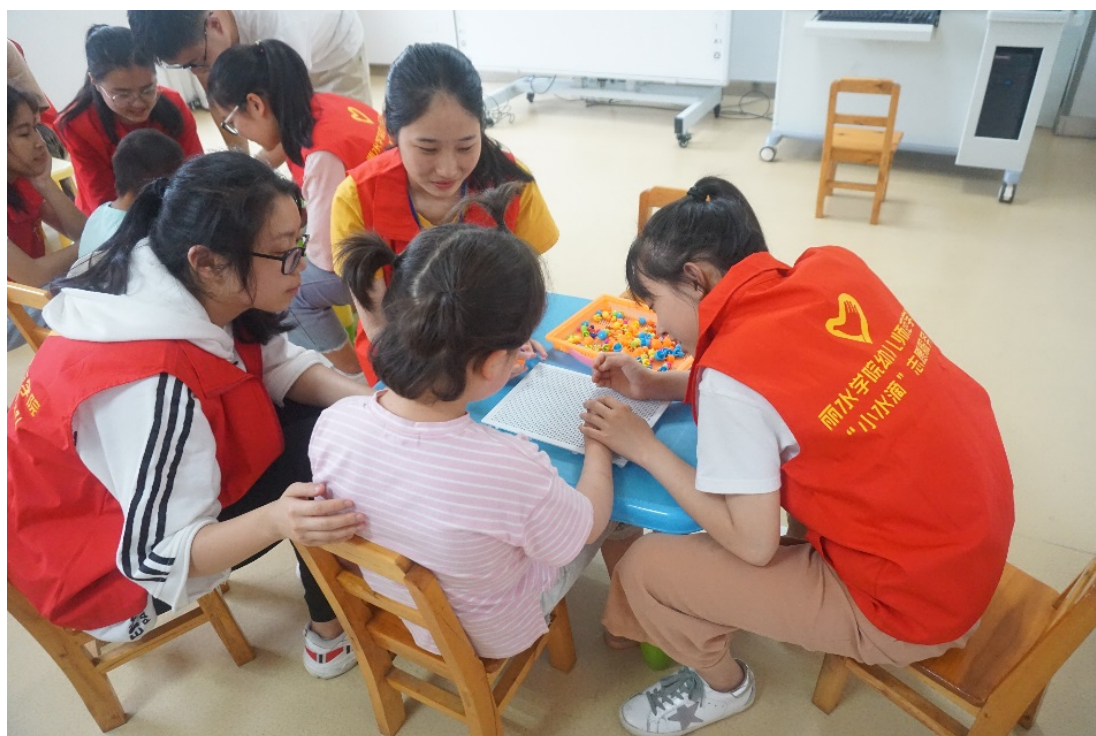
关爱特殊儿童促康复

爱心接力，“小水滴”志愿服务队一直都在。在今后的关爱留守儿童行动中，“小水滴”志愿服务队还会继续扩大社区、乡镇关爱留守儿童队伍，采取“一助一”、“多助一”长期结对服务面，壮大宣传力度，使关爱行动长期惠及更多的留守儿童。