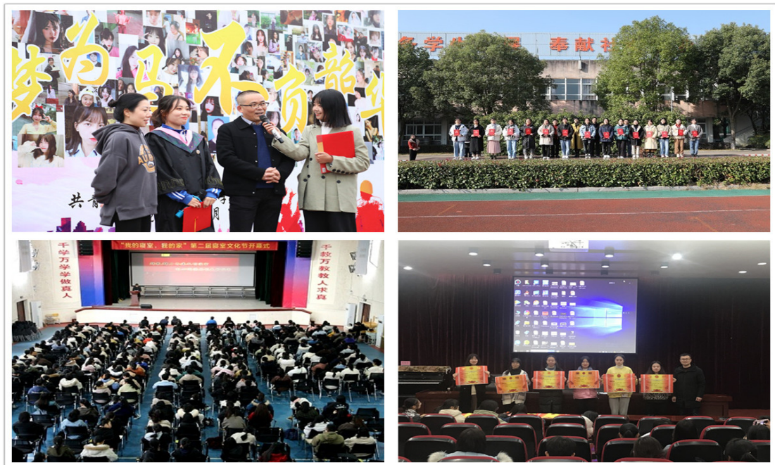
成人礼；校园女生节颁奖仪式；寝室文化节开幕仪式；优秀社团颁奖仪式

3.5.1 德育课实施情况。紧紧围绕“优雅女子塑造工程”，挖掘自身优势，依托校园女生节、社团文化节、十八岁成人礼等品牌活动丰富学生校园文化生活。根据校情、师情、学情，根据学校的培养目标与特色追求，紧密结合优雅女子塑造工作，整合校本课程、学生社团活动、班团活动课等构建了德育课程体系： 1. 必修课（11 门-心理健康教育、政治常识、经济与生活、哲学常识、毛泽东思想和中国特色社会主义理论体系概论、形势与政策、幼儿教师师德修养、学生职业生涯规划与就业指导、军训及始业教育等）； 2. 选修课：（1）限定选修 4 门（幼儿园家庭与社区教育、教育诊断与幼儿心理健康指导、教育哲学、幼儿园班级管理）；（2）校本课程 4 门（汉字与传统文化、生活中的法律常识、时事政治、食品营养与保健等）；（3）学生社团活动 34 门； 3. 百科讲坛（每周五）； 4. 班团活动课（分年级建立主题教育库）； 5. 特色活动课程（每年定期举办校园女生节、社团文化节、毕业典礼、成人礼、中华经典群诵比赛等）