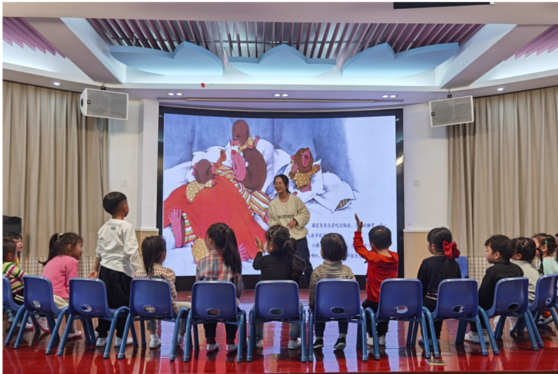
温州第四幼儿园实习生展示课评课活动

学生开展为期三天的教育见习。本学期学校与温州第四幼儿园签订合作协议，成为我校第 27 个校外实训基地。