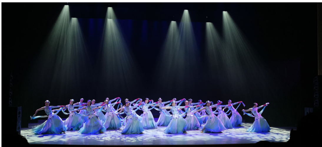
《天浴》浙江省大学生艺术节舞蹈类一等奖

3.5.4 社团活动。目前，32 个社团正常开展活动，基本实现了社团的自我管理、自我服务、自我教育。本学年，多个社团承办了校级比赛及专场演出，如：光影协会承办的摄影比赛；啦啦操协会和街舞协会分别承办的专场演出等。与此同时，我校还组织社团参与各类地方服务、演出与展出活动，如：礼仪协会参与松阳县委、团县委组织的松阳县首届人才科技周等活动的礼仪服务，充分展现了我校优雅女子的气质和风采；声乐协会、剪影手工社及汉文化社参与了由松阳县文旅局主办的“松古物语”老街文旅市集活动；同时，组织社团成员积极参与各级各类比赛，有效推动会员专业能力提升。