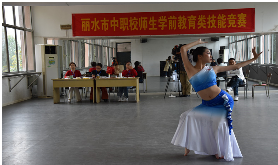
学校承办的丽水市第十八届中等职业学校师生学前教育类技能竞赛