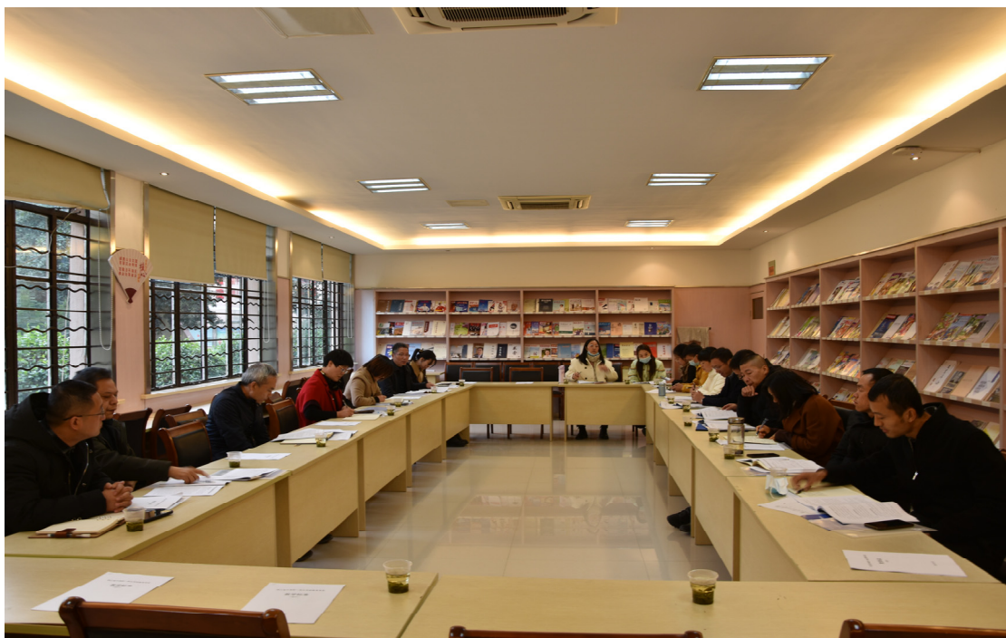
2020 年秋合作学校负责人联席会议在我校举行