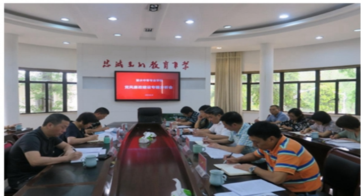
党员干部到横樟村警示教育基地参加现场警示教育；党风廉政建设专题分析会。