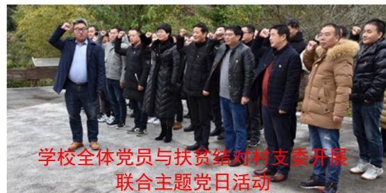
学校全体党员与扶贫结对村支委开展联合主题党日活动