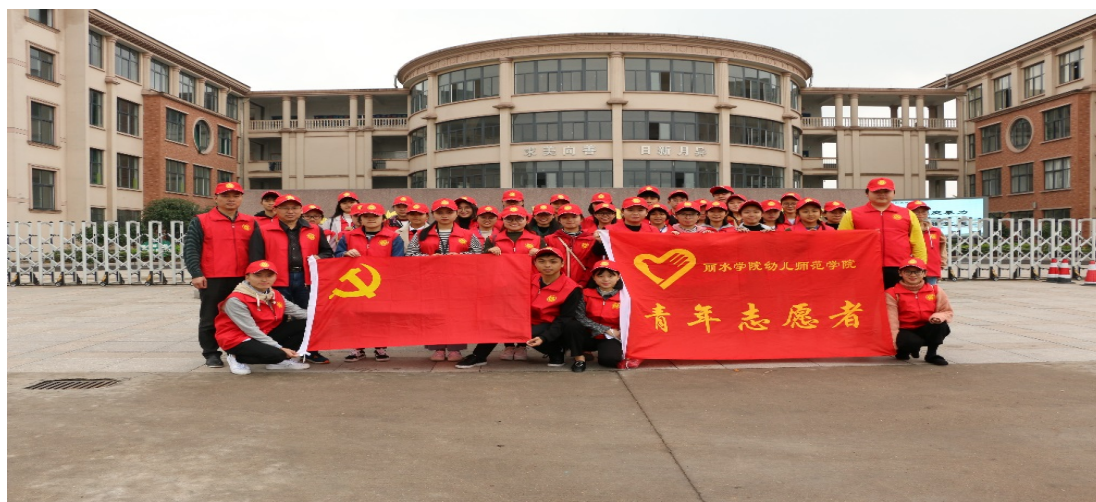
志愿者在松阳县城北小学

1983年，丽水中等专业学校成立了松阳师范“学雷锋送温暖”小组，2016年取“滴水之恩，润泽四方”之意，更名为“小水滴”志愿服务队。三十余年，在继承和发扬志愿服务光荣传统的基础上，丽水中等专业学校志愿者倡导“参与就是力量，实践改变社会”的志愿服务理念，倾力打造“关爱留守儿童”、“关爱夕阳红”、“文明交通劝导”、“青春治水”、“爱心助残”等品牌项目。曾被省教育厅、团省委、团市委授予“学雷锋活动先进集体，省市志愿服务先进集体等荣誉称号。由于志愿服务方面的出色表现，丽水中等专业学校团委多次获省、市级先进团委，曾被团中央授予“全国五四红旗团委”。