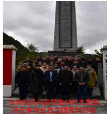
全体党员与扶贫结对村支委到庆元参加红色主题党日