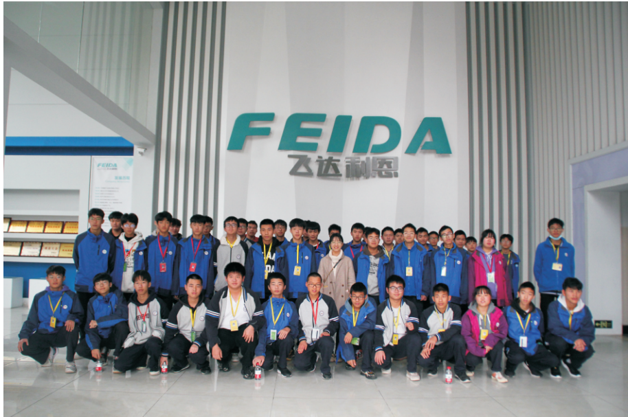
图为数控技术应用专业现代学徒制试点