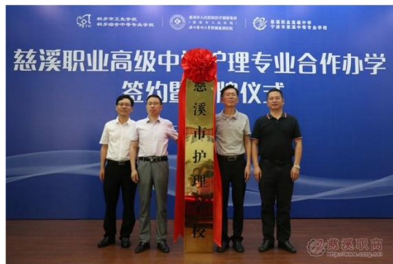
图 3：慈溪市护理学校授牌现场