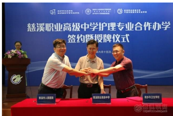
图 2：慈溪职高护理专业合作办学签约暨授牌仪式