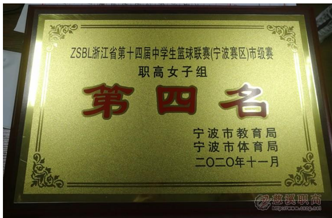
图 6：我校女子篮球队获得 2020 年浙江省中学生篮球赛宁波赛区高中女子组第四名

我校女子篮球队在 2020 年浙江省中学生篮球赛宁波赛区获得高中女子组第四名，校男子、女子篮球队获得慈溪市中小学篮球赛男子组第 5 名、女子组第 3 名。校男子足球队获得慈溪市第十二届中学生校园足球联赛高中男子组三等奖。我校被认定为慈溪市 2021 年度至 2023 年度学校体育业余训练点。