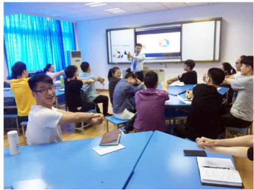
图 16：学校语文教研组获评宁波市优秀教学团队