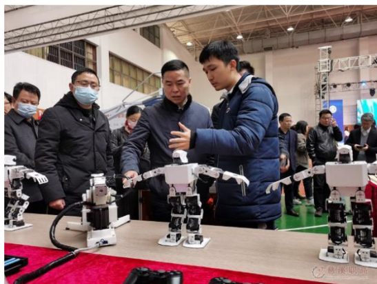
图 8：市领导现场听取学生创客作品介绍

【案例 6】12 月 22 日，慈溪市职业教育成果展亮相宁波市第十五届技能大赛。成果展上，我校围绕“秘色瓷都，智造慈溪”的主题，结合本校的色，精选了发绣、纸艺、机器人、3D 打印等一系列的项目，展示了学校在文化传承、专业建设、创业创新教育等方面的成果。展览期间，宁波市教育局党委书记、局长毛才盛一行在我校展区内饶有兴趣地观看了学生的机器人操作演示，与学生亲切交谈，听取了学生创客作品介绍，对于学生的创新意识、动手能力以及学习成果表示了肯定。