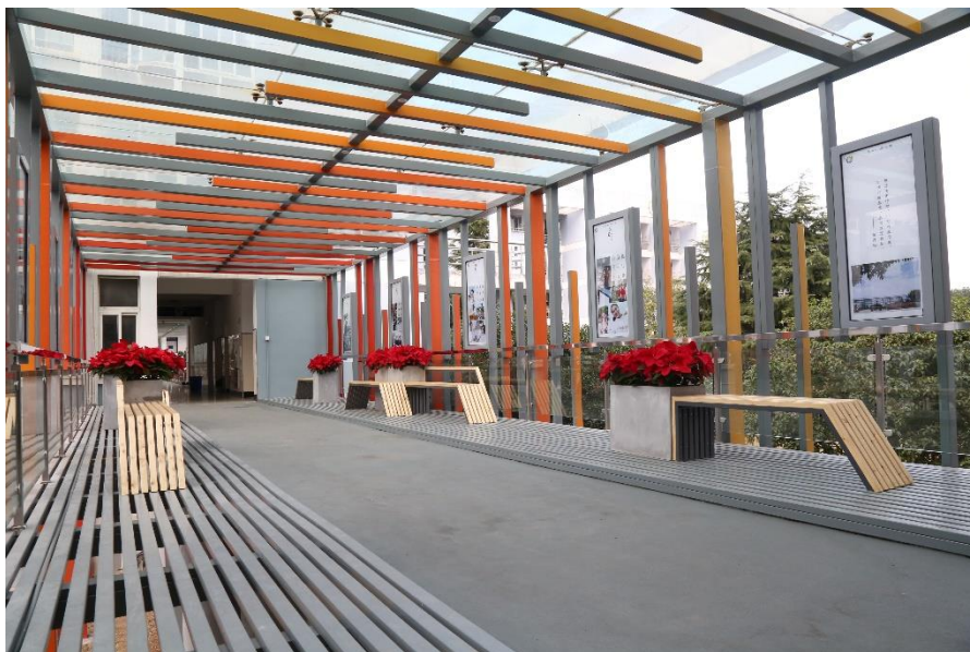
图 21：一平米文化长廊一角