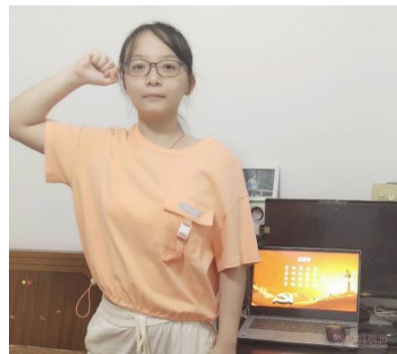
图 7：学校开展暑期线上“劳动教育”