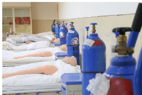
图 14：护理实训中心一角