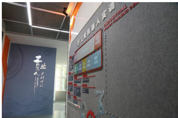
图 13：工业机器人实训中心投入使用

为提高实训管理效率，2020 年，学校全面推行实训管理系统，在各专业实训课使用，将我校“7S”管理和实训教学管理升级到无纸化，为下一步学生个性化学习采集积累数据。