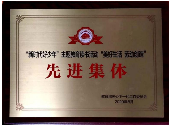
图 22：被授予“新时代好少年·美好生活 劳动创造” 主题教育读书活动先进集体

【案例 14】在教育部关工委开展的“新时代好少年·美好生活 劳动创造”主题教育读书活动中，我校被授予“新时代好少年·美好生活 劳动创造”主题教育读书活动先进集体称号，学校校长在总结表彰大会上作代表讲话。