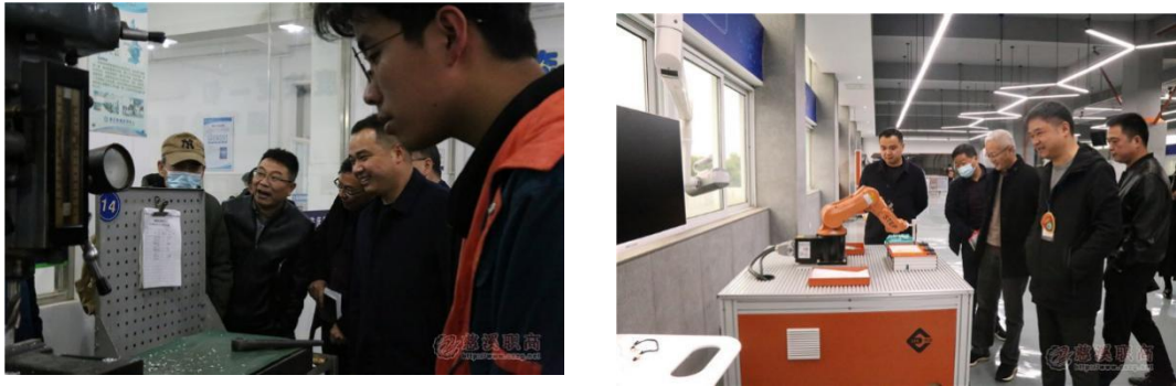
图 25：客人们参观实训基地和综合实训区

【案例 16】2020 年 12 月 8 日湖州中职校长参观团一行 17 人前来我校参观访问。客人们首先在微格教室聆听了我校宁波市语文骨干教师展示课，接着参观了车工实训室、铣车实训室、创新实验室、机械综合实训区及学校新落成的工业机器人实训中心，并进行了高职考经验交流。