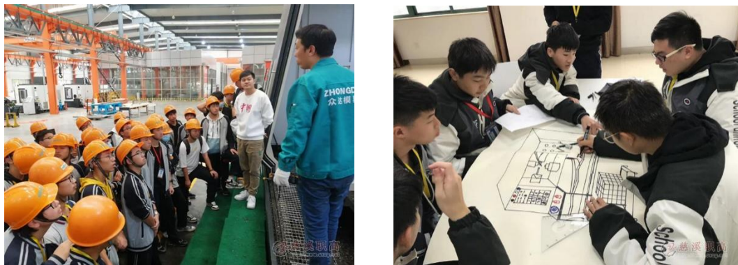
图 11: 机电专业 2020 年现代学徒制度点学生下企业见习

德智能传动股份有限公司, 新海科技集团有限公司和宁波新登辉模具科技有限公司参观学习。