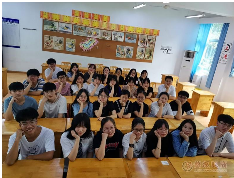
图 10：2020 年美术专业本科上线全省第一

【案例 7】2020 年浙江省高职单招单考成绩揭晓，慈溪职高本科上线共计 85 人，继续位列慈溪中学校第一位。据统计，慈溪职高 2020 年本科上线总人数比 2019 年增加了 25%，而 17 美术实验班和 17 机械实验班的本科率更是高达 71.42%和 58.14%。