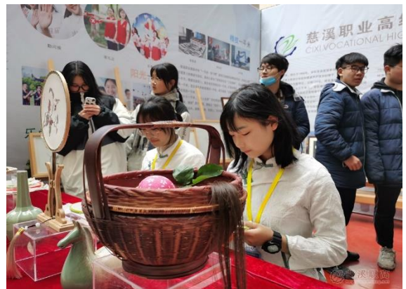
图 9：学生展示发绣技艺