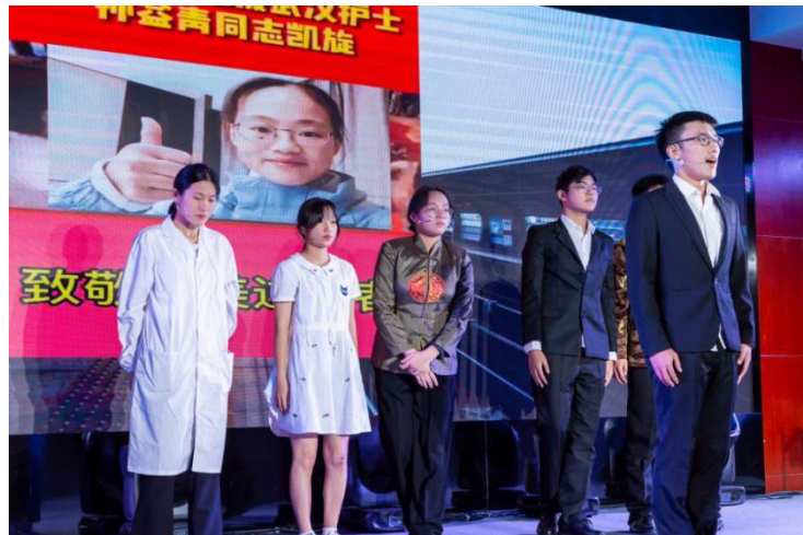
图 23：《出征》荣获宁波市“红梅赞”故事荟比赛一等奖