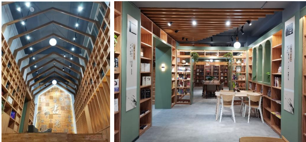
图 20：慈溪职高紫藤书屋一角

【案例 13】为丰富师生的课余时间，丰富校园文化内涵，积极推进书香校园的建设，慈溪职高开放式阅览室（紫藤书屋）已于 2020 年 12 月 14 日新装亮相试开放。紫藤书屋采取校企合作模式运行，新华书店合作进行日常运营，与超星集团共建图书系统，体现出现代化的书吧理念。书屋位于原图书馆一楼，书屋内设计精致、布置温馨，为师生提供了 3500 余种图书，并提供电子阅览屏和朗读亭等在线阅读体验，是集读书、休闲、交流于一体的充满浓郁人文气息的阅读空间。