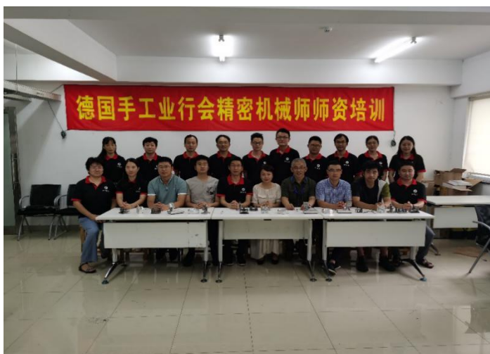
图 15：10 位教师参加德国手工业行会精密机械师培训

【案例 11】2020 年 7 月，江苏省相城中等专业学校与德国手工业行会合作举办的首届“中德合作师资培训班”开班。我校机械、电气等共 10 位参训教师出席了开班仪式，并接受第二期的德国手工业行会（HWK）暑期师资培训。培训期间，参训教师集中精力认真钻研，敞开思路深入交流，通过培训提升自身业务素养，将德国“双元制”职业教育理念和教育模式转化成为符合我国国情的职业教育模式，并运用到教育教学实践中。