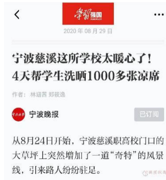
图 1：学习强国报道我校为新生晒席