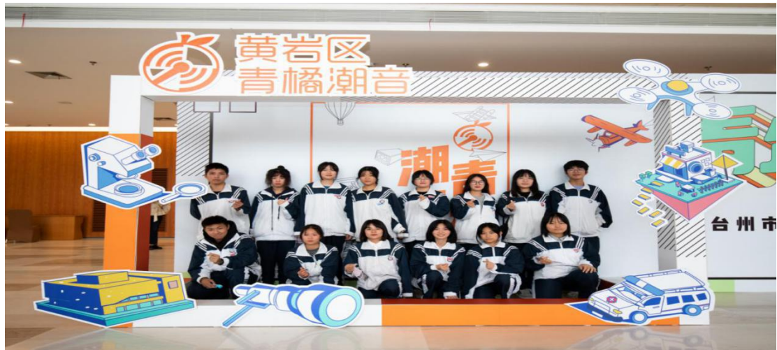
参加橘音听潮理论宣讲分享会