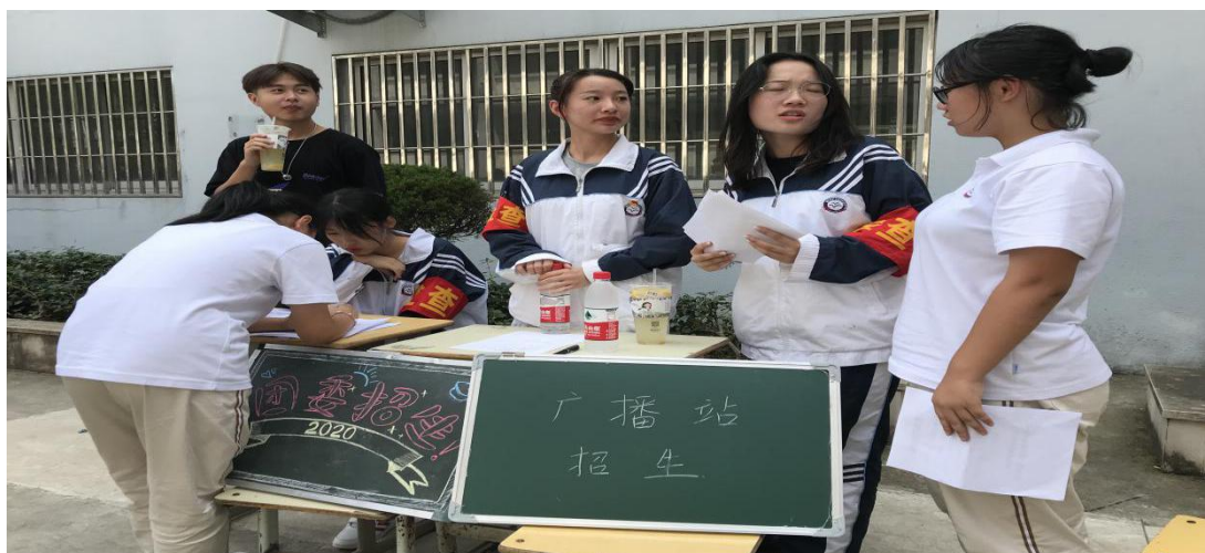
新学期各部门招新