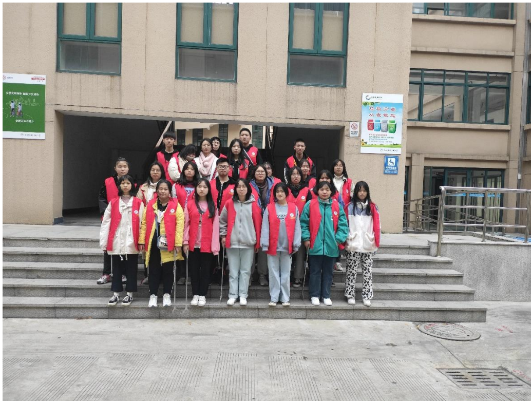
每周一次，组织社会实践部志愿者们开展美化校园活动