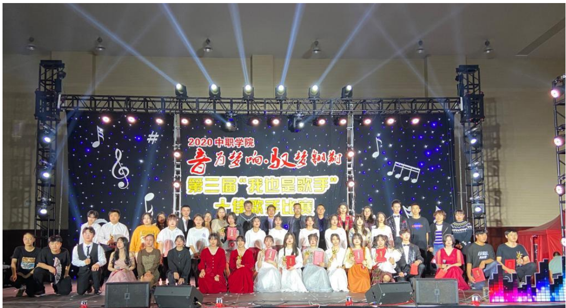
11月12日，中职业学院“音为梦响·驭梦翱翔”十佳歌手比赛决赛