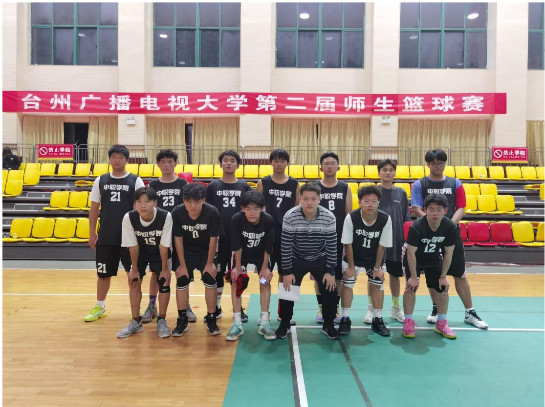
11月，组织学生参加校篮球友谊赛