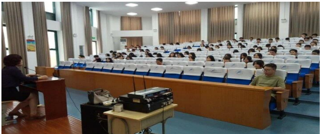
9月23日，召开全院寝室长会议，加强网格化管理 9月28日，组织“安全教育”主题班会