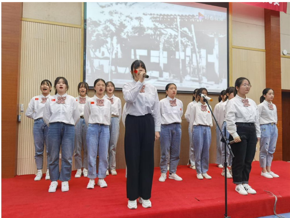
10月22日，中职学院“诵千古美文 扬传统文化”国学朗诵比赛决赛