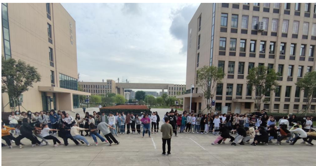
10月，中职学院拔河比赛