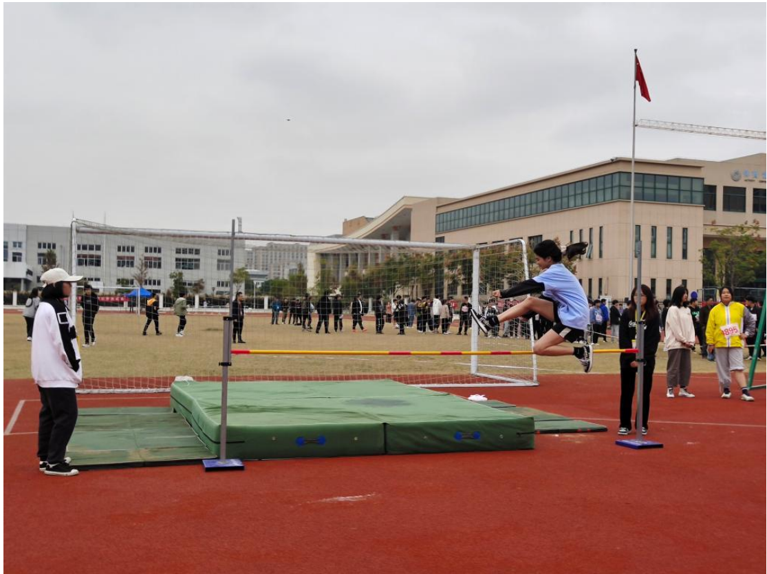
11月24-26，组织学生参加校运动会