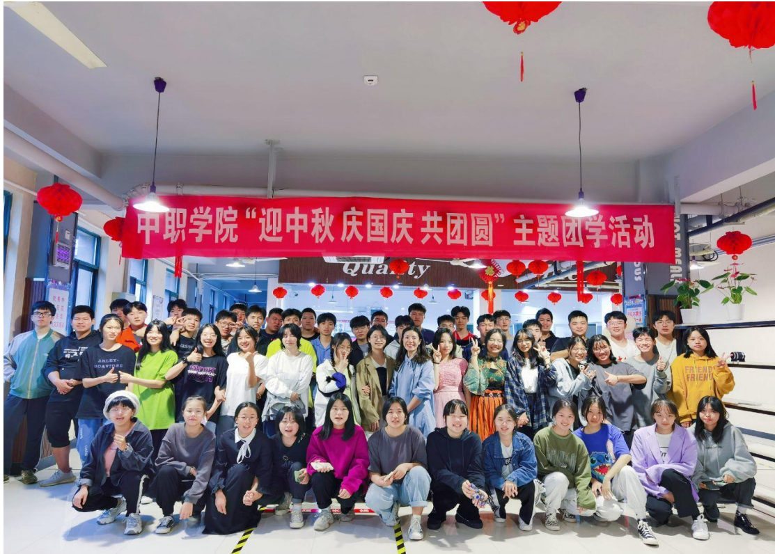
9月29日，中职学院开展“迎中秋 庆国庆 共团圆”主题团学活动 10月12日，组织“文明卫生工作”主题班会