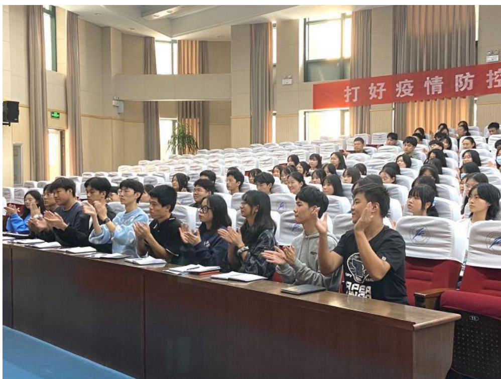
10月26日，举行全院学生干部培训讲座