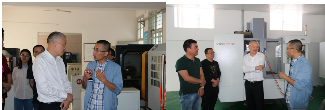
（先进的全新数控机床设备）

建有校内实训中心 5 个，教学工厂 1 个；仪器设备总值达 1500 万元以上，生均仪器设备值达 6690.8 元。目前网络多媒体教室 42 间，投入教学（含办公电脑）的计算机 571 台，学生每 3.16 人拥有 1 台教学计算机。生均实训实习工位 701，与上一年度相比增加 27 个，学校纸质图书共 28576 册，生均纸质图书 15.82 册，与上一年度相比生均增加 3.02 册。