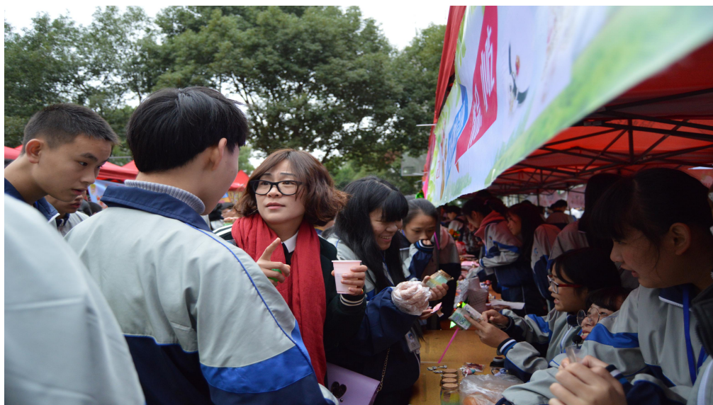
(搭建学生校内创业平台)

我校高度重视国家助学金以及贫困生助学工作。中职助学金的发放，严格按申请、评选、公示、审核程序进行。2020年，学校共计落实国家助学金58.1万元，用于资助家庭经济困难学生的学习和生活费用开支。学校设立学期奖学金，奖金丰厚；超达阀门集团设立“超达奖学金”，奖励“开大超达班”品学兼优的学生。学校通过成立学生创业中心、艺文书吧、文体超市、环保银行、商贸节等形式，鼓励学生工学结合、勤工俭学。