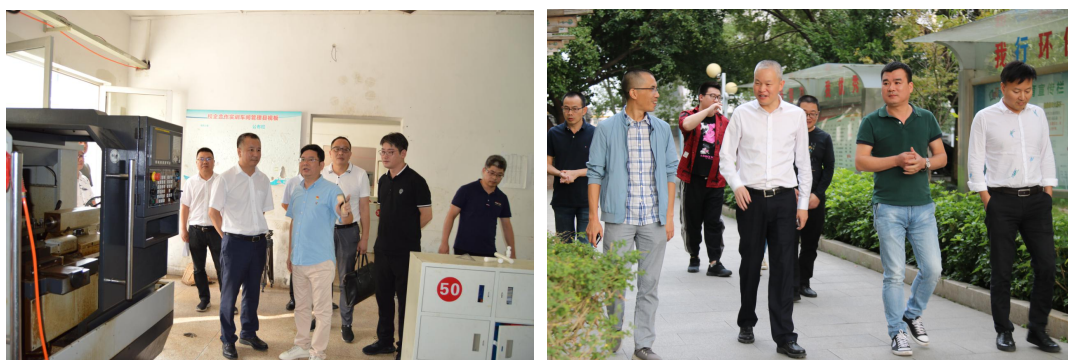
（林万乐县长、黄金锡局长来校指导）

上级领导高度重视学校建设，县委常委、县长林万乐，县教育局黄金锡局长来校调研中职办学及县职教中心情况。上级将积极出台相关政策，支持学校利用地处瓯北的区位优势，抓好与高职院校优质教育资源的对接合作，与行业企业尝试不同所有制混合，校企深度融合，促进教学质量大幅提升。