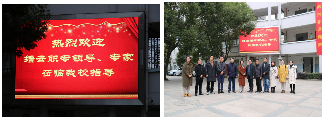
（学校宣传电子屏、与缙云职专校园文化交流学习）

3.5.5 凝练文化精神 学校总结和凝练二十七年的办学经验，不断挖掘校园文化内涵和精髓，建成了校园文化长廊，有书籍、木桌椅、饮料、音乐等，书香气息浓郁。还装置了硕大的校园广场电子屏，除公示学校重要通知外，闲暇时间播放各类励志影片、经典歌曲等。学校录播教室，给信息化课堂提供了保障。学校大门柱上刻有“技能宝贵 劳动光荣”八个大字，这正是永嘉三职精神的缩影，学校形成了以“修德砺能铸艺精技”为核心的校园文化体系。