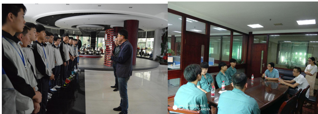
(泵阀制造技术专业学生赴伯特利、超达开展社会实践课活动)

导和专题训练,来推进学生的职业发展。学校通过改革教学模式和教学评价方式,来促进学生学会学习,培养了学生的学习能力。我校学生的岗位适应能力、岗位迁移能力、创新创业能力均得到了社会的好评,特别是得到了伯特利、超达、亚龙、报喜鸟等相关企业的信任。