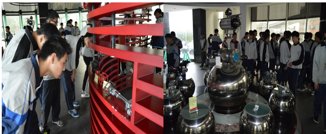
（阀门企业见习活动）

永嘉县第三职业学校职教集团成立时，首批理事单位共 5 个，现有校企合作单位达到了 12 家。生产性实训中心 1 个（校内泵阀零部件加工中心）。在校外与企业、行业协作建立了校外实训基地 13 个，今年学生在校外实习实训基地学时总量达 481200/人时，满足了参观、阶段实习、顶岗实习等实训教学的需求。