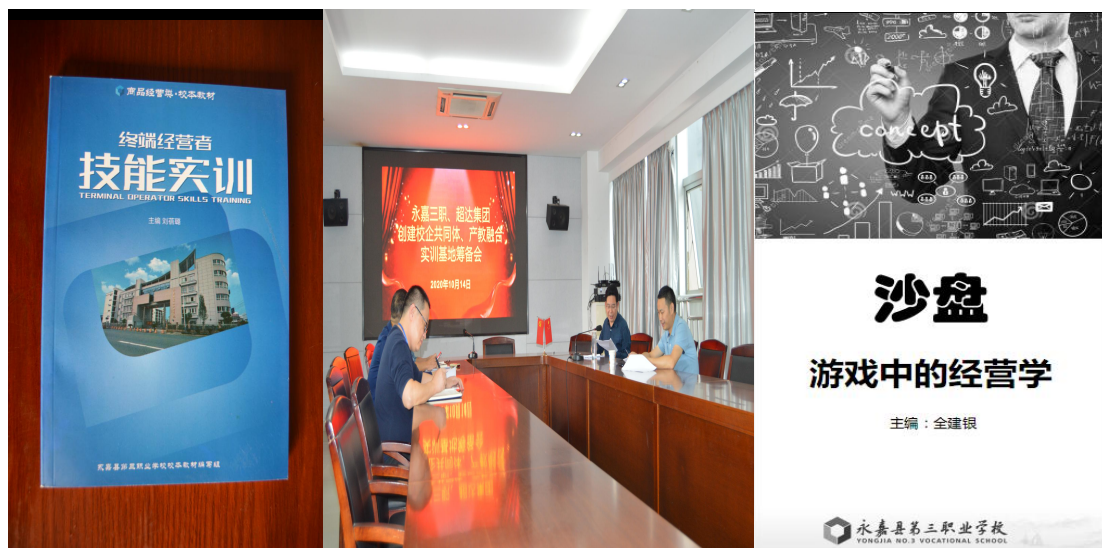
（与高职、企业共编校本教材，共建共享校企共同体）

四是增设新专业，做大做强专业群。1月22日，我校隆重举行新能源汽车维修（新能源汽车电路检修方向）、工艺美术（教玩具产品设计与制作方向）、工业机器人技术应用（泵阀智能制造方向）、增材制造技术（教玩具模型制作方向）四个新增专业论证会。专家们对我校新增专业进行了论证、审议，充分肯定了我校拟增设的新专业，符合精准对接地方支柱产业办专业的办学思路，符合社会经济发展对技术类专业人才的需求，符合区域连通、师资融通、课程贯通的中高职一体化五年一贯制职业教育新模式。