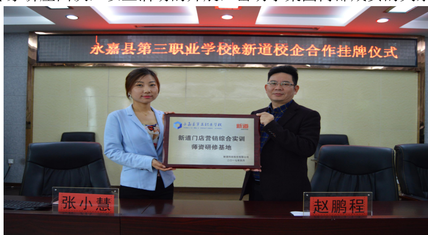
(成立新道门店师资研修基地)

在县委县政府的大力支持下，我校与超达阀门集团、开封大学深度融合，开办了“开大超达班”，共同成立了开封大学阀门学院；共同申报、创建了“智能+”产教融合联盟项目；共同编写了校本教材。组织召开了集团年会一次、教学研讨会两次、专家讲座四次，以上活动的开展，密切了集团内部成员的关系。