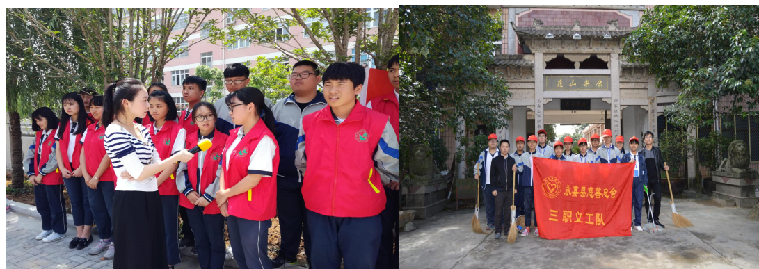
（三职环保志愿者助力瓯北城市新区五水共治、赴康乐山庄慰问老人）

3.5.1 构建德育主题体系。以立德树人为根本，突出八大主题，推进十大育人措施。用文化引领人，用榜样感染人，用活动激励人，德育活动蓬勃开展，学生文明素养显著提升，学生“愉悦学习、健康成长、人人出彩”，学校真正成为了学生人生出彩的乐园。今年，学校被评为市级毒品预防教育示范校（去年被评为县德育示范校）。