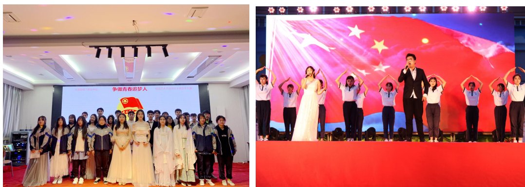
(争做青春追梦人十佳歌手大赛)

学校全面贯彻党的教育方针及习近平总书记关于职业教育的讲话精神，以立德树人为根本，不断改善基础设施，加速实训基地建设。我校在温州市青少年创客基地校基础上继续加强创客教育，市级“泵阀制造技术‘智能+’产教融合联盟”项目逐步推进。我校今年开展了校技能节、篮球赛、艺术节、十佳歌手、“清正雅言”朗诵比赛、成人礼等活动，16个学生社团活动丰富多彩。据统计，学生理论学习满意度达80.16%，专业学习满意度达88.54%，实习实训满意度达82.33%，校园文化与社团活动满意度达90.7%，校园安全满意度达89.5%，生活满意度达84.3%，使学校成为学生“学会认知、学会做事、学会生存、学会共处”的青春大舞台。