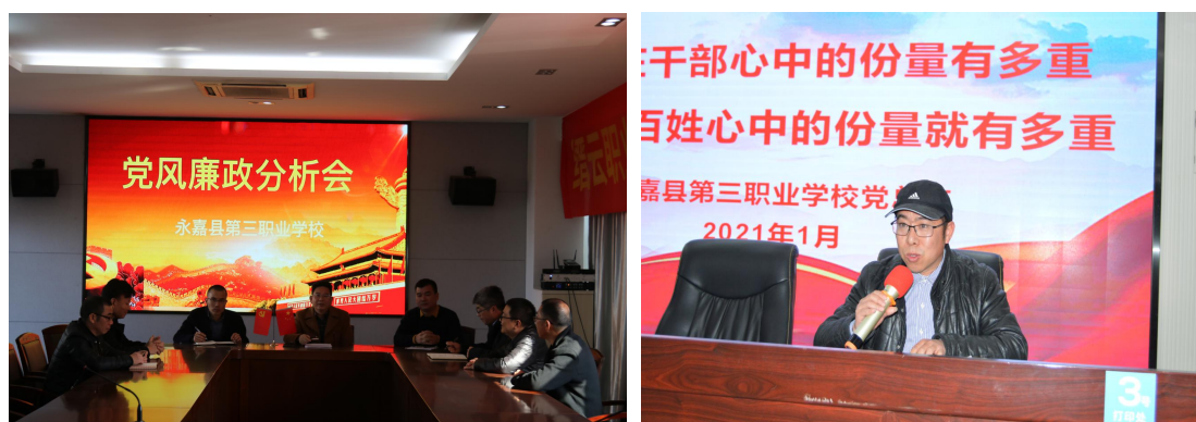
(党风廉政、述职述廉)

中全会精神，切实加强党支部的思想政治建设、组织建设、制度建设和作风建设，履行管党治党主体责任。党总支充分发挥学校基层党组织的战斗堡垒作用和共产党员的先锋模范作用，不断夯实党建工作的基础，创新党建工作的形式，丰富党建工作的内涵，拓展党建工作的外延，努力推动党建工作向更高的目标迈进，从而为深化教育教学改革、提高办学质量带来了坚强有力的保证。召开党风廉政建设工作会议、党员民主生活会，全面部署 2020 年学校党风廉政建设工作。深入开展“两学一做”活动，组织党员深入学习党章党规，学习习近平总书记系列重要讲话精神，教育党员干部严格执行《中国共产党廉洁自律准则》、《中国共产党纪律处分条例》，真正做一名合格党员。