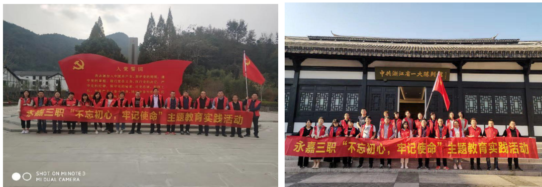
（“不忘初心，牢记使命”主题教育实践活动：追寻清风之旅）

忘职业教育初心，牢记党员时代使命”，为党的教育事业奋斗终生！组织了“倡廉洁、树师风”党员教师演讲比赛。