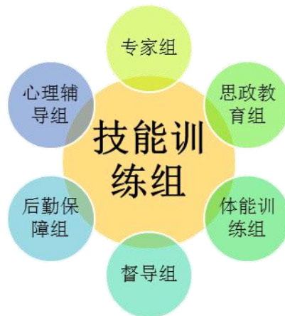
图 1：集训时技能竞赛教学结构化师资队伍

练的需求，同时保证技能竞赛教学的组织与保障，具体结构化师资队伍团队如图 1 所示