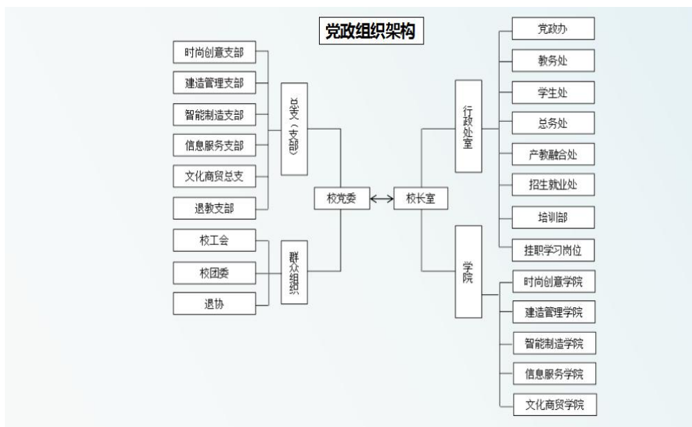
图2 学校党政组织、二级管理架构图

制的基础上，赋予学院一定的责任，根据职责的需要赋予一定的权力，使学院在学校总体目标、原则的指导下发挥管理主体的作用。纵横贯通联结的网络式管理，管理科学、组织健全，目前学校已经逐步形成教育行政部门依法宏观管理，学校按照章程自主办学、社会（家长委员会等）参与监督的基本格局。