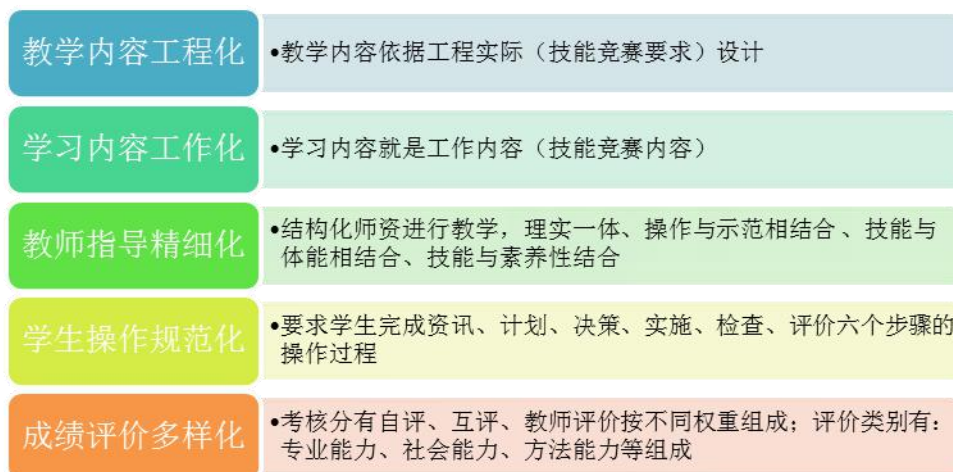
图 2：技能竞赛“五化”教学模式

“五化”教学模式实施中以教师为主导、以学生为主体、以任务为载体，实现项目知识的传授与技能的训练。在学习过程中，把沟通能力、自我学习能力、情感能力、团队合作能力、工匠精神等素养融合到专业技能的训练中，提升专业技能的同时提升相关能力素养。