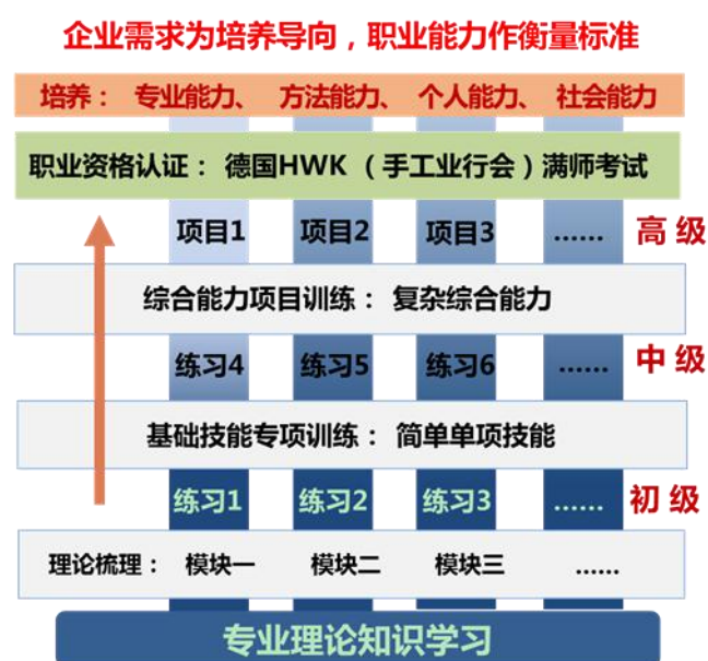
图 1 全面行动能力训练模型

职业资格证书考试”的教学训练形式。根据企业工种要求选择代表性的练习项目，从简单到复杂进行教学时间前后的科学安排，逐步完成从初级水平到高级水平的职业能力训练，最终通过自德国手工业行会考试中心组织的考证。培养模式也从学生的培养转变到学徒的培养，学生在综合项目中理解各个理论模块与实习技能的衔接，掌握各项技能之间的工艺衔接，有效培养学生的整体性思维。同时以团队模式开展项目不仅注重培养学生专业能力、方法能力，更加注重培养学生个人能力和社会能力。通过全面职业行动能力的培养，保证学生接受的实践教学与世界级工业先进水平真正接轨。