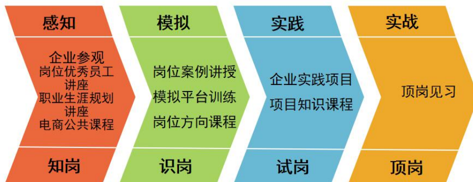
图5 “四结合”课程模块

对应“知岗-识岗-试岗-顶岗”4阶递进培养，构建“感知-模拟-实践-实战”的理实一体递进式模块化课程。(如图5)