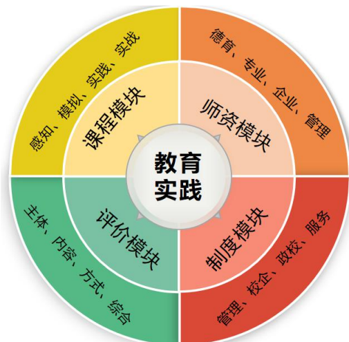
图4 “四结合”中职电商育人实践