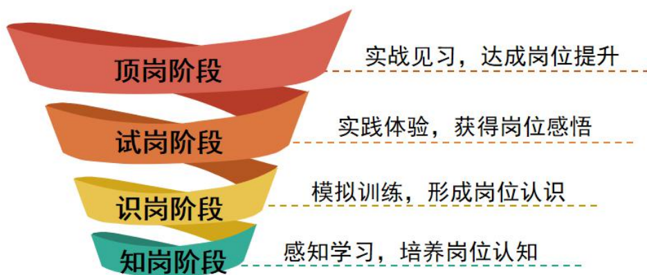
图2 “4阶”电商工作室育人模式

遵循中职学生的认知规律，开发并实施“知岗-识岗-试岗-顶岗”4阶螺旋式培养路径。（如图2）