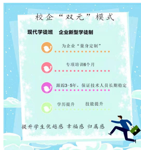
图 4 短周期人才培养的模式