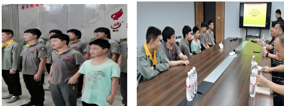
图 5 校领导与金工制造现代学徒班学生座谈（新天齿轮）

杰在金澳兰机加工车间的月薪已经达到了 9000 和 10500 元。今年六月底与武义新天齿轮共同培养的第三届现代学徒班（长周期培养）14 位学生开始了高三一年的顶岗实习，不到半年月薪已经达到 6000+。今年设立的武义三美的化工设备操作与维护现代学徒班（中周期）15 名学生均稳定在岗，学生的兴趣在“现代学徒制”人才培养过程中得到了充分的强化。