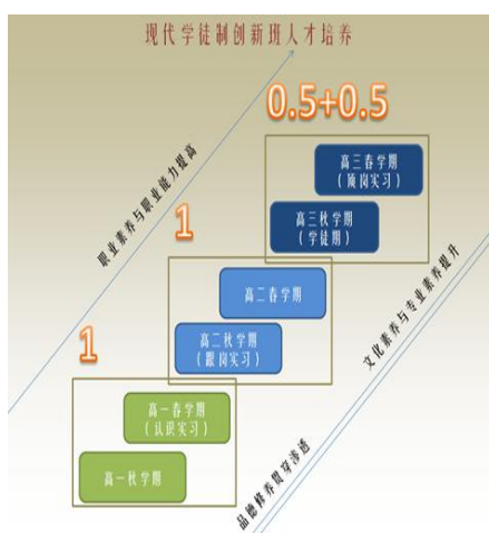
图 3 中周期人才培养在校培养周期

在政府参与下，从体系设计上对不同来源不同培养路径学徒的灵活包容，给予学徒选择不同成长路径的机会，长周期培养是中周期的预备，短周期培养是中周期的补充，更将学徒制培养的对象扩大到了企业在岗员工，育人模式的核心是中周期现代学徒制培养。