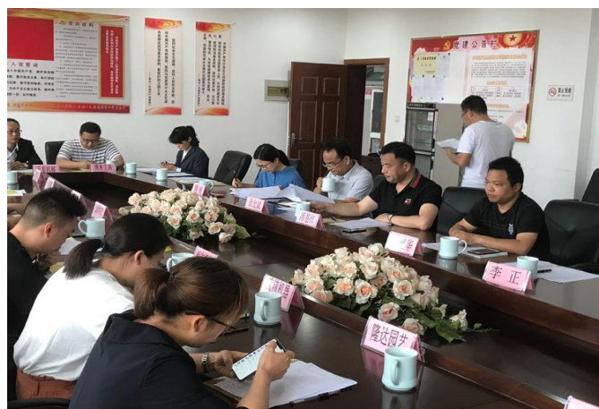
图 1 政企校三方共育，商讨人才培养

在这样的背景下，如何将选择本地直接就业的学生最大程度地培养成上述第三类人才是学校亟待解决的问题。2019 年县政府提出营造良好营商环境，职业学校必须承担起为本地培养紧缺人才的重任。学校积极响应号召，主动转变观念，与企业需求对接，控制人的“数量”，聚焦人的“质量”，打造具有地方特色的“长中短三周期结合，政企校三方共育”现代学徒制育人实践，打通学生精准培养、高质量就业的“最后一公里”。