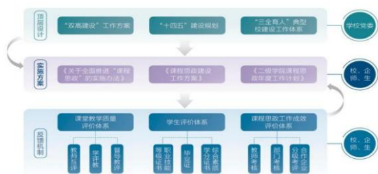
图 4 课程思政体系及实施方案