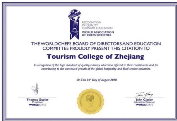
图 7 国际教学标准认证