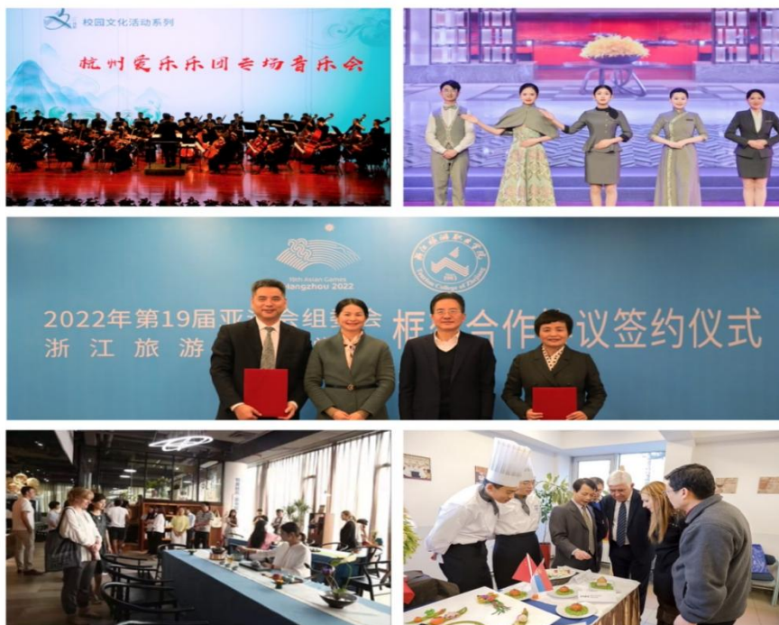
图 8 学生参与项目化教学