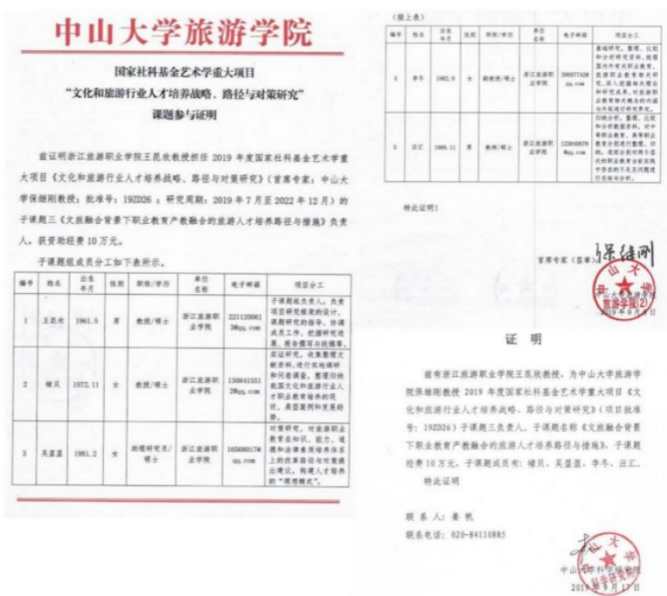
图 12 2019 年国家社科基金重大项目子项目立项名单