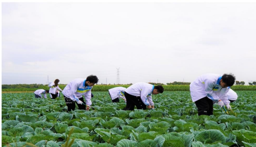
图 5 学生进行劳动教育