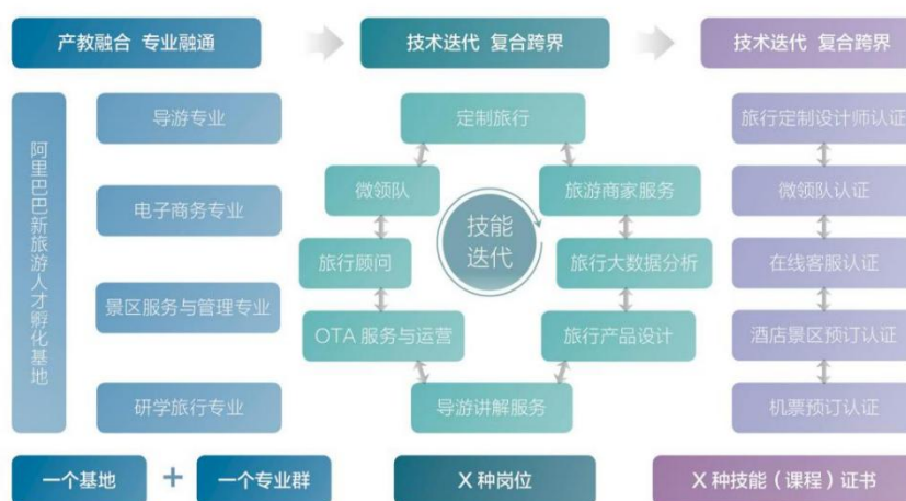
图 6 “多维立体、多岗递进”实践教学模式

融通校企： 依托浙江旅游职业教育集团、产业学院等平台， 构建书证融通体系 ，推进 18 项 1+X 证书试点，将职业岗位、职业技能与专业课程有机相融，开发相应的模块化课程、新形态教材和专业教学资源。 创新实践教学模式 ，深入校企合作、行业跨界融合创建“新旅游人才孵化基地”，在导游专业群创新“多维立体、多岗递进”的实践教学模式。