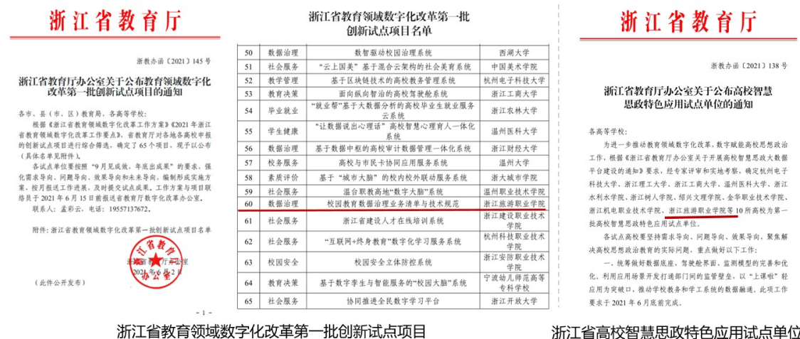
图 1 浙江省教育厅公布教育领域数字化改革试点和高校智慧思政试点文件

2021 年度学校入选浙江省教育领域数字化改革第一批创新试点学校和浙江省高校智慧思政特色应用试点，是浙江省唯一同时入选两个教育领域数字化改革试点的高职院校。同时，学校数字改革化成果入选工信部、教育部“5G+智慧教育”应用试点项目，与中央电教馆职业教育信息化建设与应用案例。