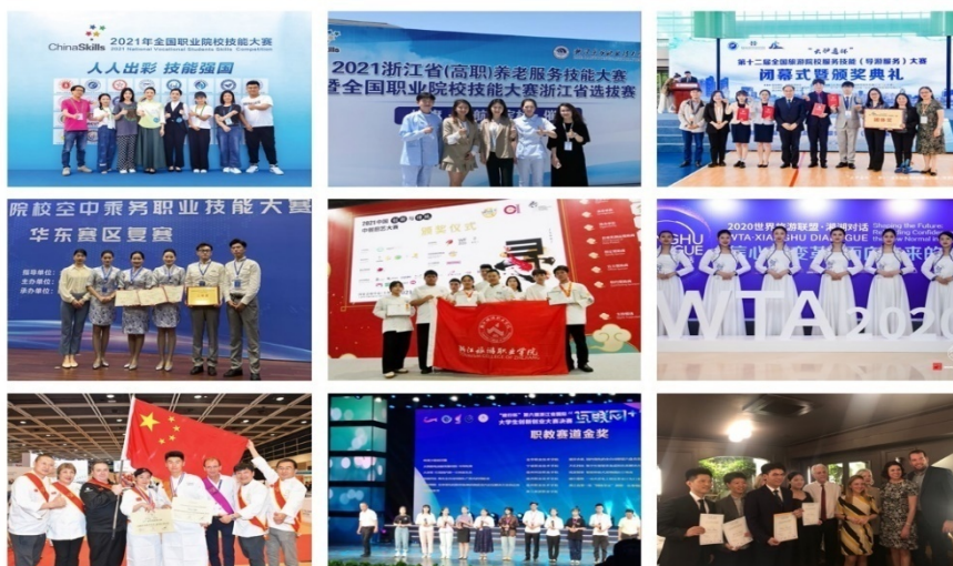
图 9 学生获得的国内外奖项

浙江旅游职业学院的实践探索取得了明显的成效。近五年学校毕业生就业率保持在 98%以上，其中 60%被国际品牌企业录用就业竞争力，起薪比普通专业毕业生高 15%，专业对口率、用人单位满意率等均位居全省高职院校前列；在校生在技能竞赛中获得国际级奖项 60 项、国家级奖项 313 项，每年赴境外高校、国际顶级旅游企业留学、实习的学生占毕业生总数的 10%以上。