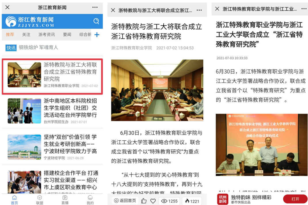
图 16 媒体关注学院成立浙江省特殊职业教育研究院