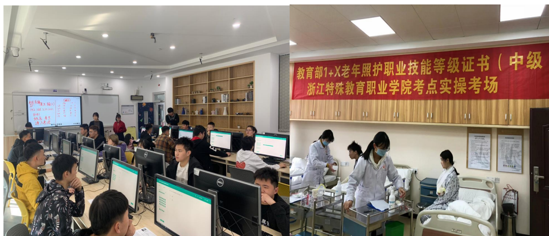
图 10 1+X 证书认证考试现场