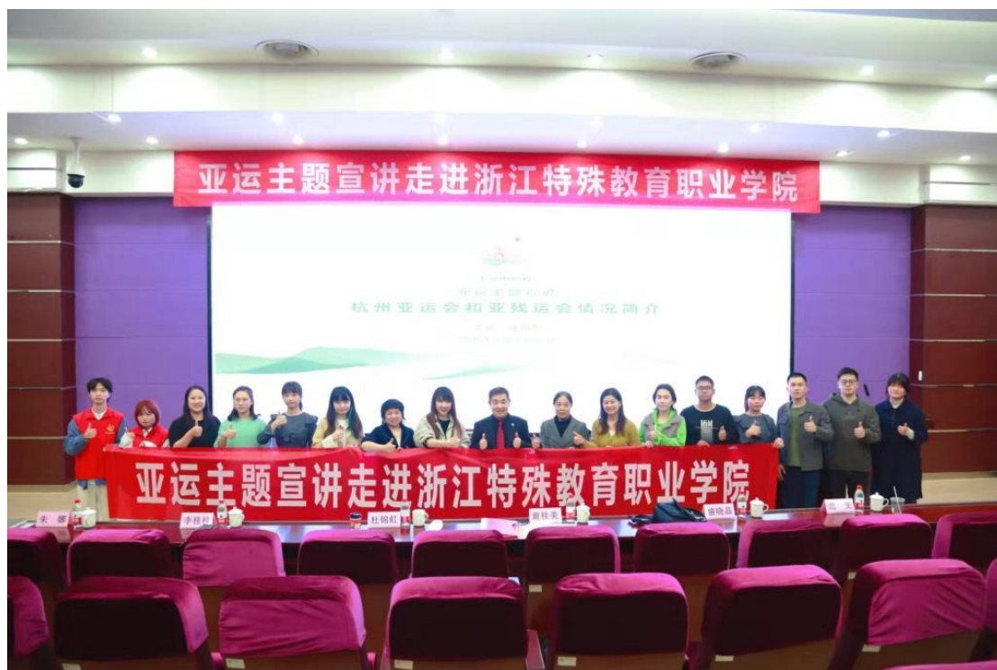
图 18 亚运主题宣讲走进学院

接亚组委，在师生中开展亚运志愿服务宣讲、报名、海选。鼓励师生以饱满热情的姿态迎接亚运，弘扬志愿文明理念，展现新时代特教青年风貌，推动残疾人在更高层次、更广范围参与和融入社会生活，促进社会的和谐、稳定与进步。