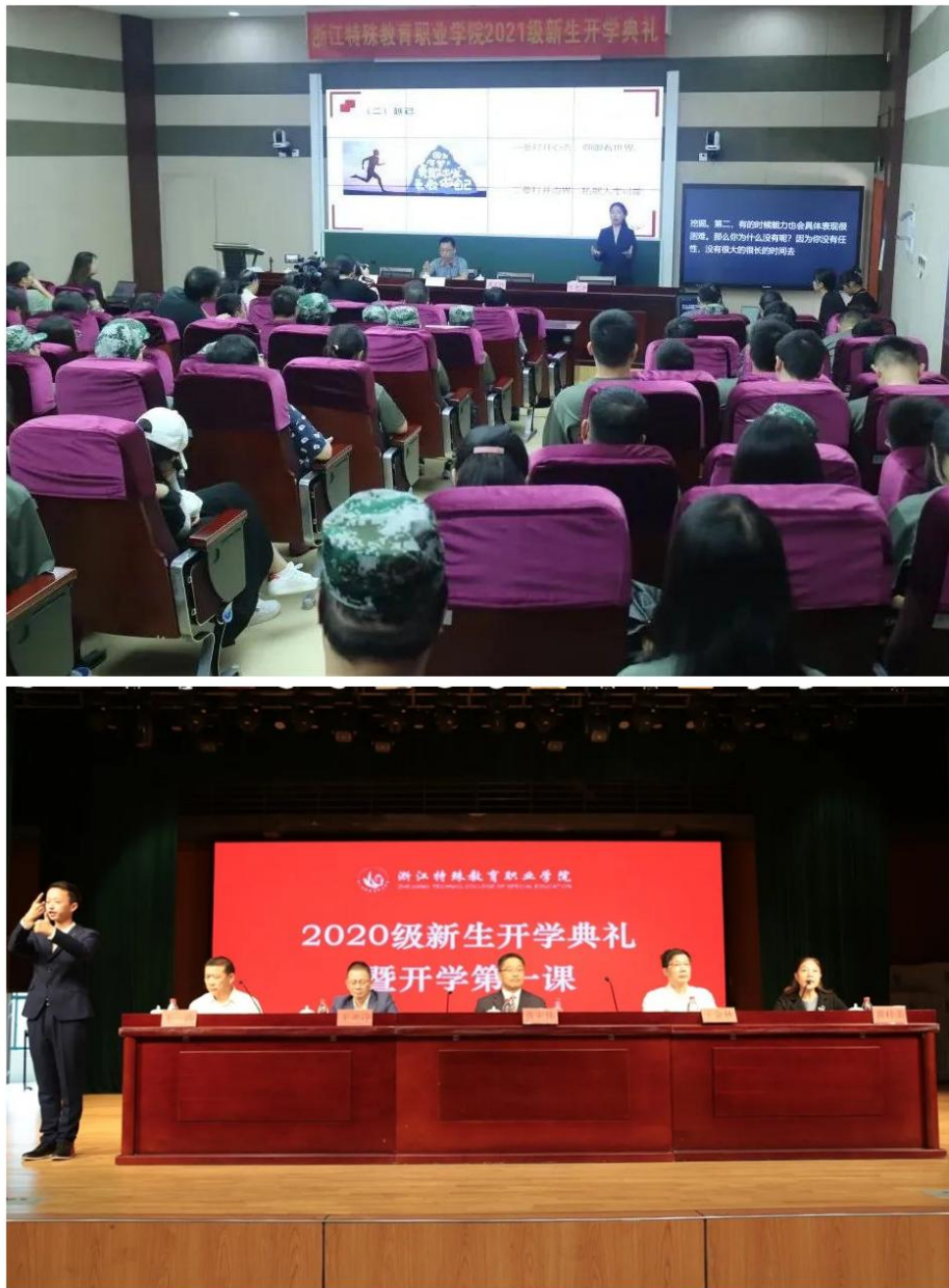
图1 学院开学典礼暨开学第一课