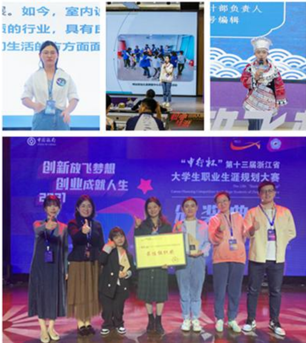
图6 第十三届浙江省大学生职业生涯规划大赛学院获奖学生、教师