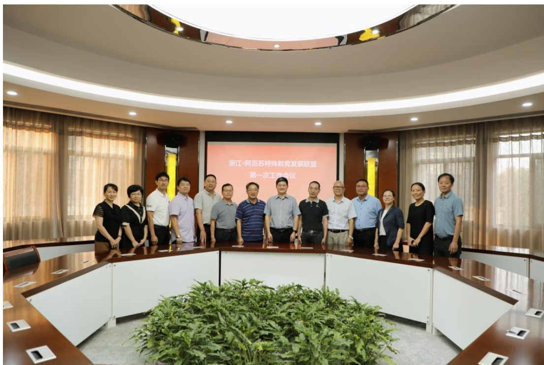
图 17 “浙江—阿克苏特殊教育发展联盟”第一次工作会议现场