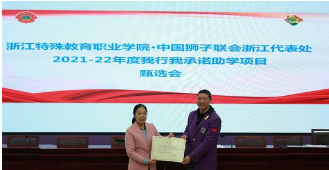
图5 2021-2022 学年“我行·我承诺”大学生助学项目甄选会

专项补贴方面，为帮助经济困难学子，学院开展“阳光助跑 爱在特教”精准帮扶。本学年累计发放爱心床上用品达 73 人次。临时困难及时解决，学院对于遭受临时突发性事件而导致生活困难的学生，给予临时困难补助，本学年共资助 8 人，合计金额 27000 元，以保证学生正常学习生活。