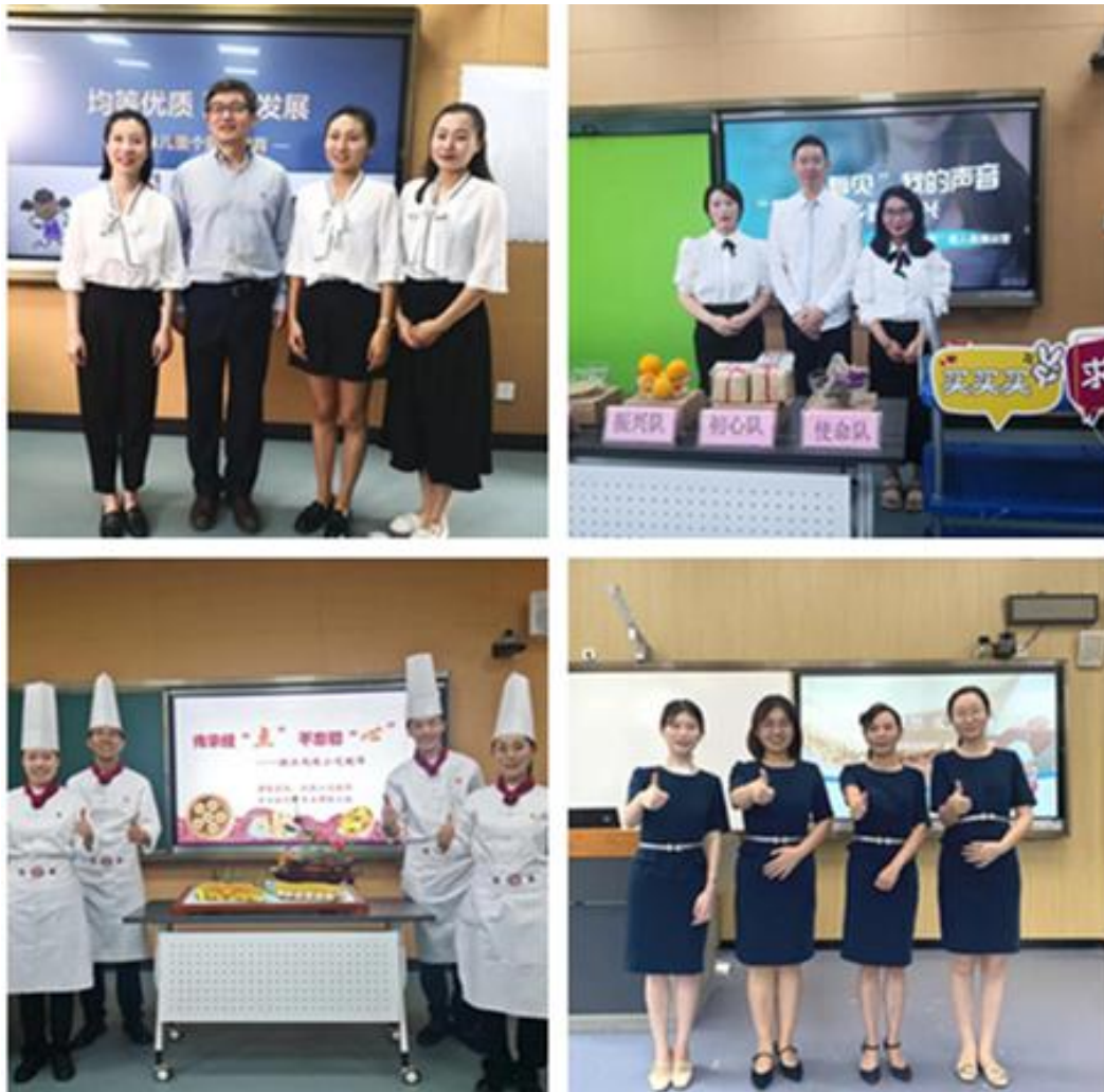
图 13 学院 2021 年浙江省高职院校教学能力比赛参赛队伍