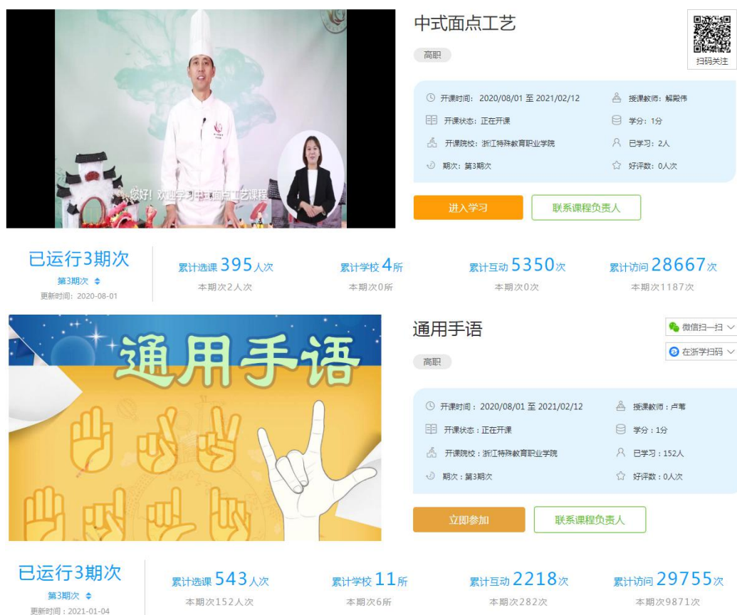
图 11 浙江省精品在线开放课程建设项目

2021年，学院全面落实《浙江特殊教育职业学院在线开放课程建设应用与管理办法（试行）》，并开展校级精品在线课程建设申报工作，新立项院级精品在线开放课程6门。全面落实《校本教材建设管理办法（试行）》，并组织开展2021年度新形态教材建设，新立项院级新形态教材7部。