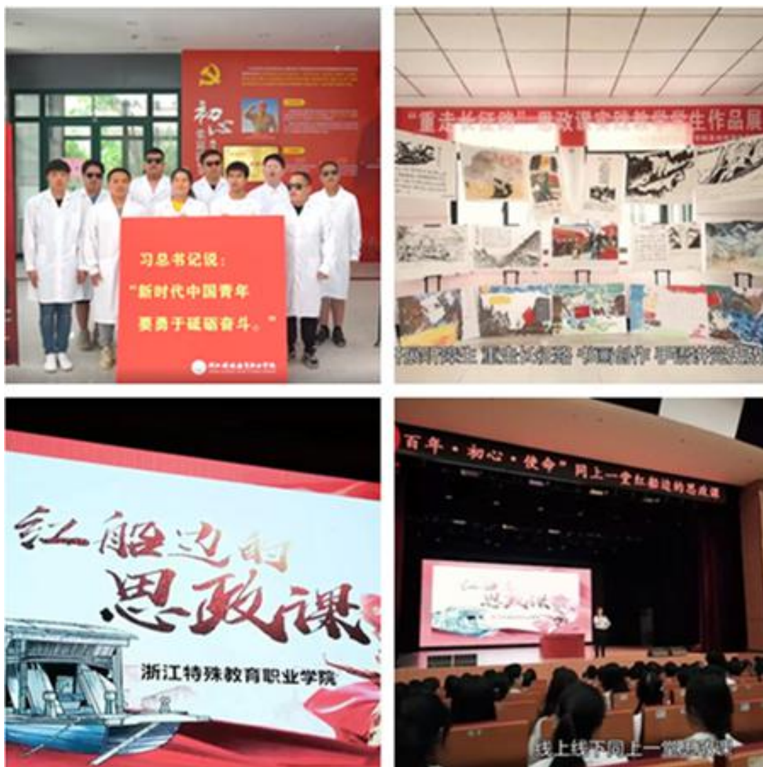
图2 学院“四史教育”实践教学系列活动引多家主流媒体关注