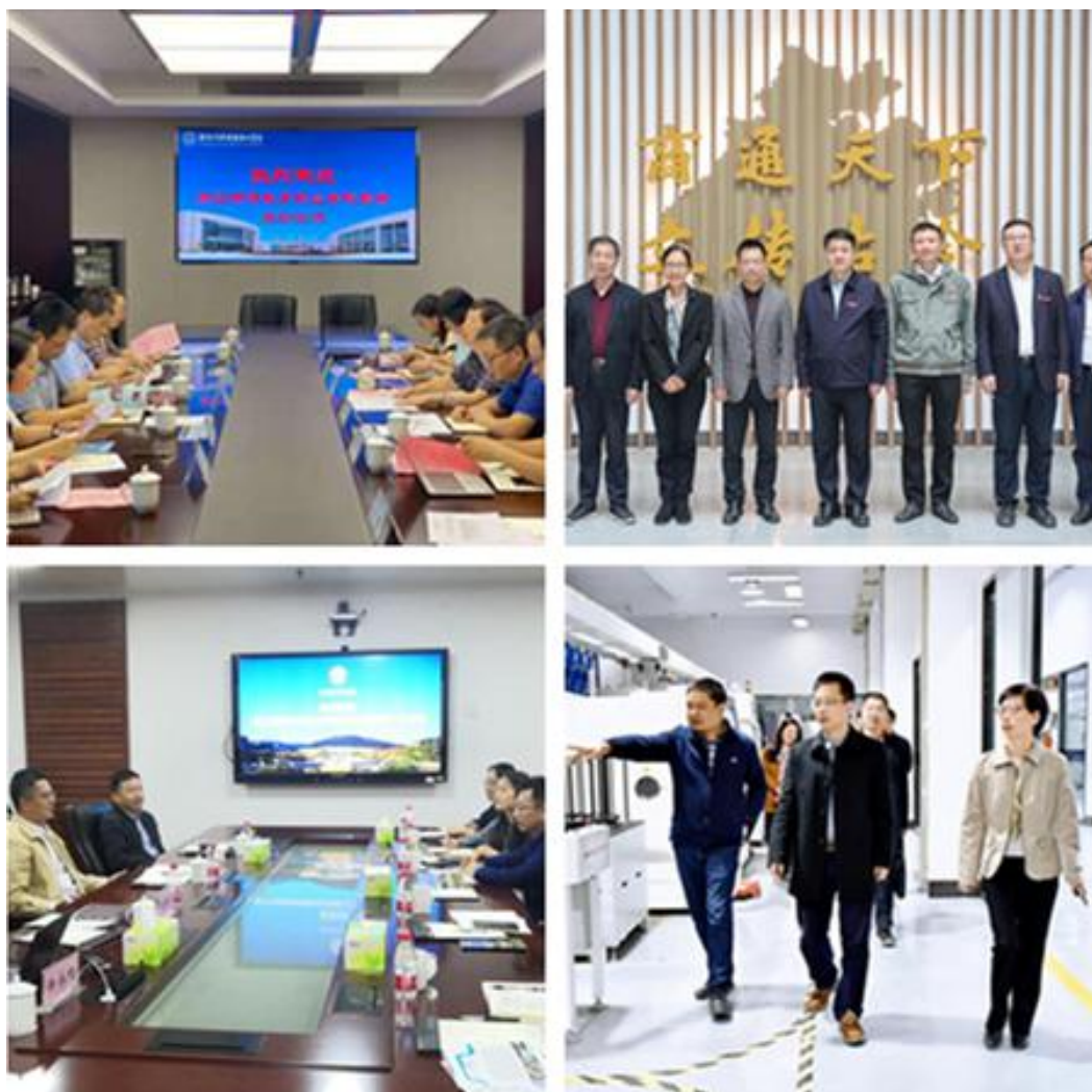
图 15 学院领导赴兄弟院校考察调研

校际联合开展“3+2”人才培养方面。2021年，学院与浙江省盲校、宁波特校等达成校校合作共识，在中西面点工艺、康复治疗技术（推拿）两个试点专业深入对接“3+2”中高职合作，联合创新共育人才，提升盲人就业层次。与浙江科技学院、浙江中医药大学开展专升本衔接，联合本科学士生，搭建人才培养立交桥，打通学生学习上升通道。