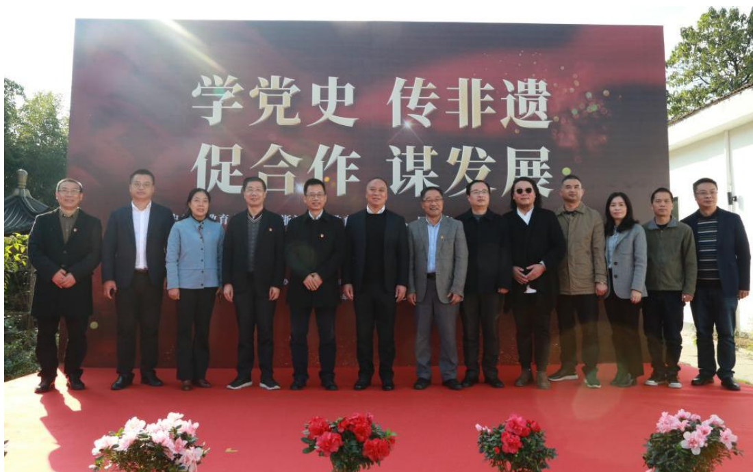
图 7 学院成功牵手匠铜实业开展非遗助残

11月8日，“学党史 传非遗 促合作 谋发展”党史学习教育办实事暨浙江特殊教育职业学院、匠铜实业（杭州）有限公司校企合作签约仪式在杭州建德市乾潭镇的刘华铜文化艺术馆举行。学院切实把“我为师生办实事”落到实处，进一步拓宽残疾大学生就业路径，为全省高质量发展建设共同富裕示范区提供助残实践。双方将在高校产教融合的基础上建立铜文化的产学基地，学校选优秀教师和业务骨干参与企业科研项目开发、技术改造、技术援助和学术研讨；企业为学生提供跟岗实习、顶岗实习、跟岗就业等工作机会，通过校企双方的深度合作和多维度的教学培养，共同为残疾人就业拓展新渠道，为中国悠久的铜文化注入新的血液。