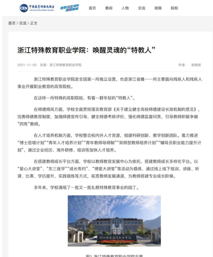
图 14 学院选送的“提质培优、增值赋能”优秀案例在中国教育电视台展示

院：唤醒灵魂的“特教人”》成功入选典型案例，并在中国教育电视台相关平台进入公开展示。近年来，学院持续探索“残健融合 协同共培”的特殊教育类高职院校育人模式，建成了社会适应教学、新业态技能提升、创新创业助力型的国内有影响力的“普特融合”职教师资队伍。十三五期间，20余名教师获得省级及以上荣誉。学院将以此次入选“提质培优、增值赋能典型案例”为契机，在政校企协作打造卓越特殊教育教师队伍上持续发力，切实有效地推动“双高”建设。