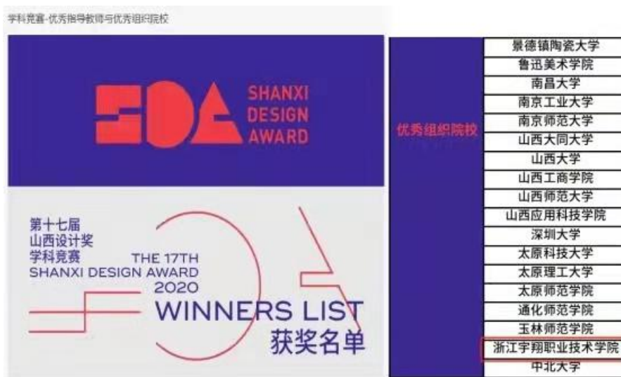
图 5“第十七届山西设计奖”学科竞赛