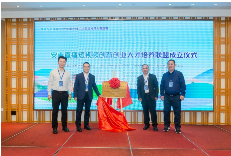
图 22 学校牵头成立直播短视频人才培养联盟

结合区域经济培养适用工匠人才。2021年9月，与安吉县政府、“两山电商学院”展开合作，建立直播人才培养职教联盟，致力于农特产品直播销售、绿色家居行业跨境电商人才培养，服务地方更进一步。