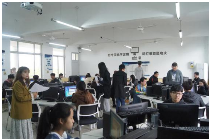
图 17“金手指”会计技能大赛比赛现场