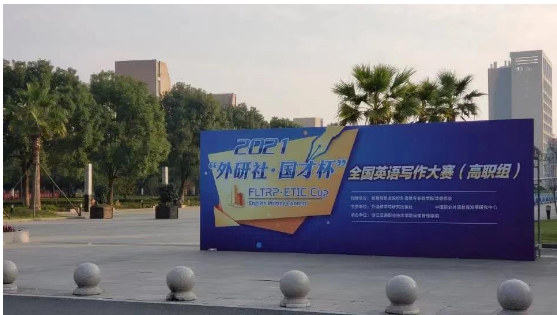
图 4“外研社·国才杯”全国英语写作大赛（高职组）