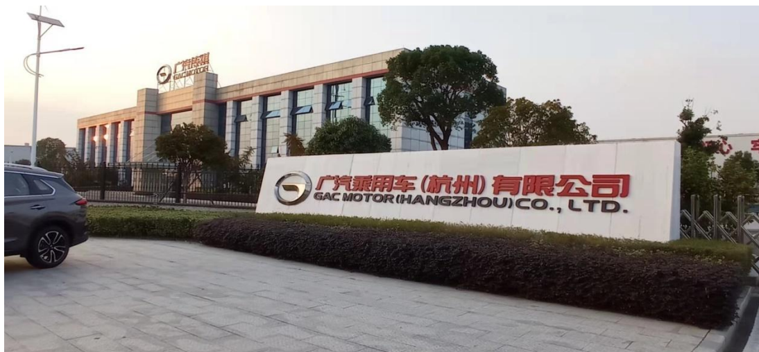
图 18 参观杭州广汽

学校开展以“工匠精神”的“产教融合、校企合作”创新模式，将科学技术服务地方企业纳入合作重点，和企业建立将顶岗实习的学生纳入企业骨干员工的培养规划。