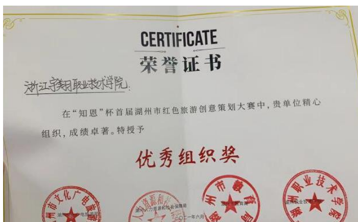
图 15 获奖奖状