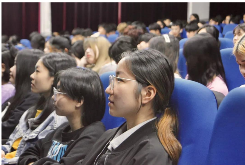
图 25 学生认真观影

本次活动以“重温红色经典，传承革命精神”为主题，进一步带领同学们了解革命烈士的作战艰辛以及伟大的革命精神，值得同学们学习与传承。观影结束后，每位学生都写了精彩纷呈的观后感。