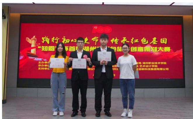
图 14 获奖学生