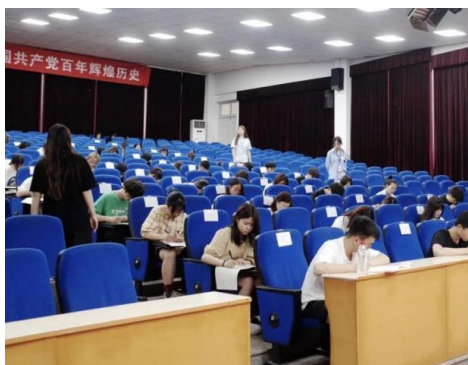
图 12 学生参与党史知识竞赛活动