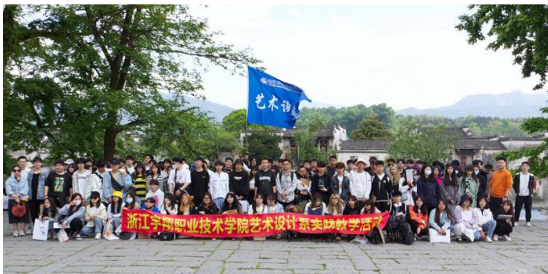
图 10 全体 20 级学生赴安徽黟县宏村进行专业户外写生创作实践教学活活动

作实践教学活活动，写生期间开展“感悟传统文化，增强民族文化自信”文化分享会，回校后，在吴昌硕纪念馆开展了“点亮红色青春 感悟传统文化”绘画展，与吴昌硕纪念馆达成了教育实践基地的合作，在社会上广受好评，为庆祝建党 100 周年献上别样的贺礼。