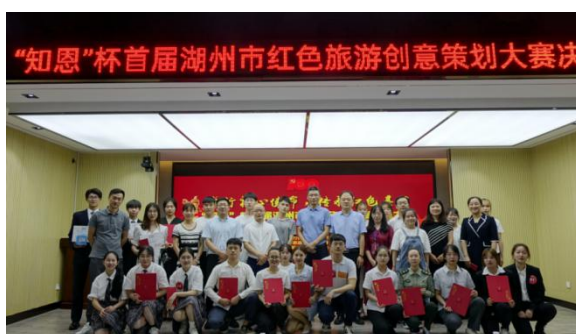
图 13 湖州市红色旅游创意策划大赛