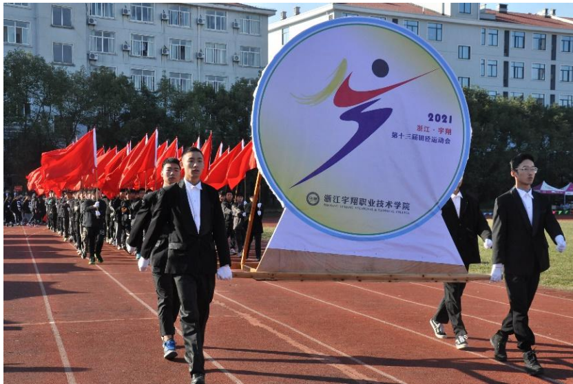
图 7 学校运动会