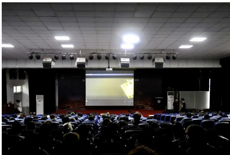
图 23 学生观影现场

2021年是中国共产党成立100周年，为纪念中国共产党100周年，回顾党的奋斗史，讴歌党的光辉业绩，充分展示新时代青年的精神风貌和时代风采，进一步增强学生组织凝聚力和战斗力，我校青年志愿者协会承办“红色观影”系列活动。