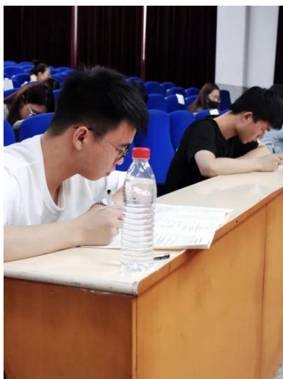
图 11 学生参与党史知识竞赛活动

考试过程中，每位决赛选手都安静、沉思、挥洒激扬文字，展现了宇翔学子学为智用、诚信做人、勇于担当、争做社会主义合格接班人的优秀品质。