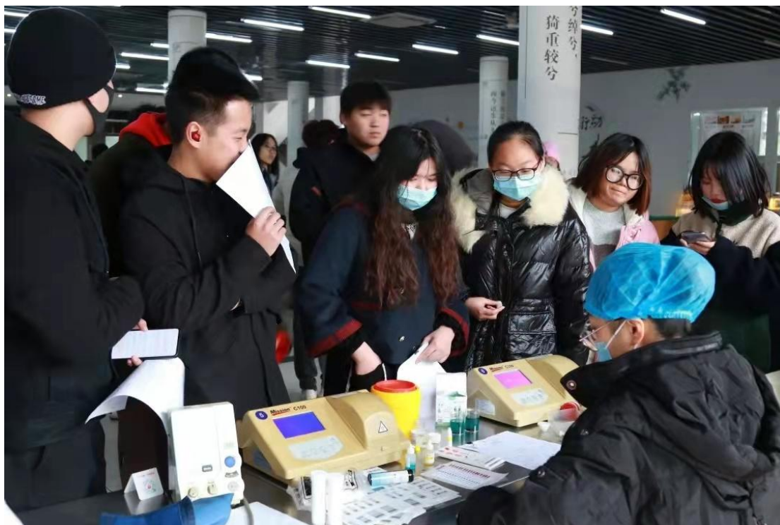
图 3 献血活动

(二) 走出校园、服务社会。学院公益志愿服务活动以习近平新时代中国特色社会主义思想为指导，走出校门，服务社会，践行社会主义核心价值观。从身边做起，从小事做起，服务他人、奉献社会。院志愿者协会是安吉县志愿者协会五大先进样板之一。目前正式注册志愿者 3124 人，自行组织开展或参加社会组织志愿服务活动近 120 次。