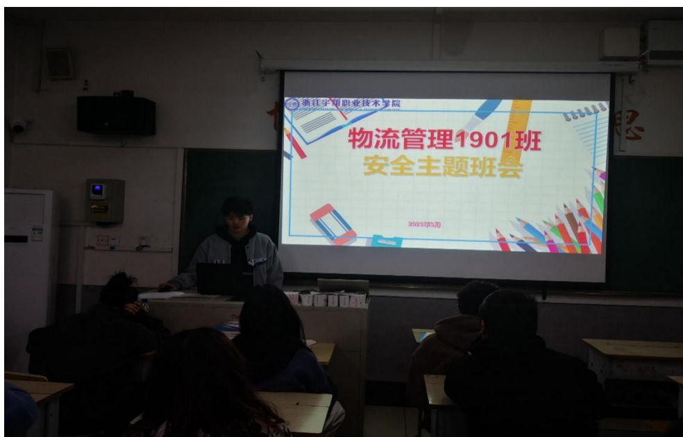
图 8 物流管理 1901 班召开疫情防控安全主题班会

最后，张老师要求大家坚决配合执行校园封闭式管理，坚持非必要不出校，有特殊情况确需出校的，严格履行申请审批制度。注意自身每日健康防护和监测排查，杜绝安全隐患。