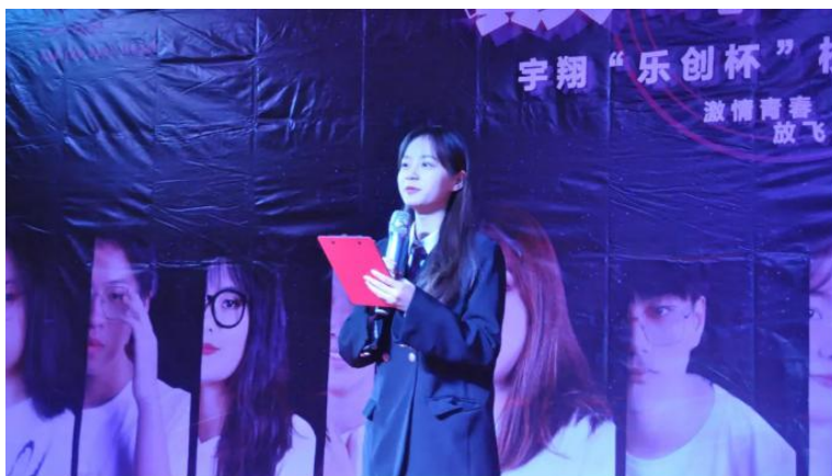
图 29 校园歌手大赛主持人拉开序幕

2021 年 11 月 ,学校组织了校园歌手大赛 ,同学们踊跃报名 ,比赛精彩纷呈 ,同学们出彩表现给评委和观众带来了一场盛大的听觉盛宴。才华和个性交织碰撞 ,奏响欢歌 ,激情和梦想在学生的歌声中耀眼闪光。