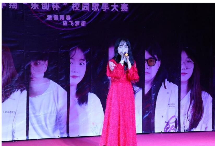
图 30 校园歌手比赛现场

此次歌手大赛中 ,同学们踊跃表现 ,用音乐表达情感 ,打动未来 ,一展歌喉。同学们尽情的发挥自己的音乐才华 ,将自己的歌声表现的淋漓尽致。