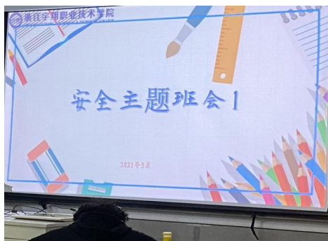
图 7 高职视传 1902/1903 班安全主题班会

理不松懈、立德树人全方位、智能管控全覆盖、精细服务暖人心、以人为本聚人心。学院把疫情防控与学生思想政治教育有机结合起来,讲好疫情防控这堂深刻、生动、鲜活的思政课,具有理论和现实意义。组织开展“大学生的责任与担当”“众志成城防疫无疆”等线上线下主题班会 156 个班次,学生参与率 99.86%,满意率 99.45%。组织全院师生观看全国大学生同上一堂“疫情防控”思政大课直播,每位学生撰写心得体会。我校学生积极主动担当作为,108 人参与守护家园防疫保卫战,在高速路口、街道、社区、村庄等地都能看到这些学生志愿者的身影。学生返校后 365 名参与到防疫志愿者队伍中来,服务 1985 人次。开展表彰优秀防疫志愿者表彰会 1 场,表彰校内外优秀志愿者 269 人。学院辅导员、班主任将疫情防控当成立德树人最好的教材,围绕疫情开展了爱国主义教育、生态文明教育、责任担当教育、心理健康教育、感恩教育等。教育引导学生在党的领导下,进一步坚定制度自信,增强爱国主义与厚植家国情怀,践行使命担当与责任坚守,培养敬畏生命与感恩意识,增进法纪意识与提升职业素养等。通过实行校园封闭式管理、学生网格化管理,全面加强值班值守工作,全力做好线上教学、管理育人、宣传教育、校园消杀等工作,做到底数清、目标明、任务清、责任实,确保了师生如期顺利开学复课、企业有序复工复产。全校师生始终保持“零感染、零疑似”,做到疫情防控与事业发展“两手硬、两战赢”。