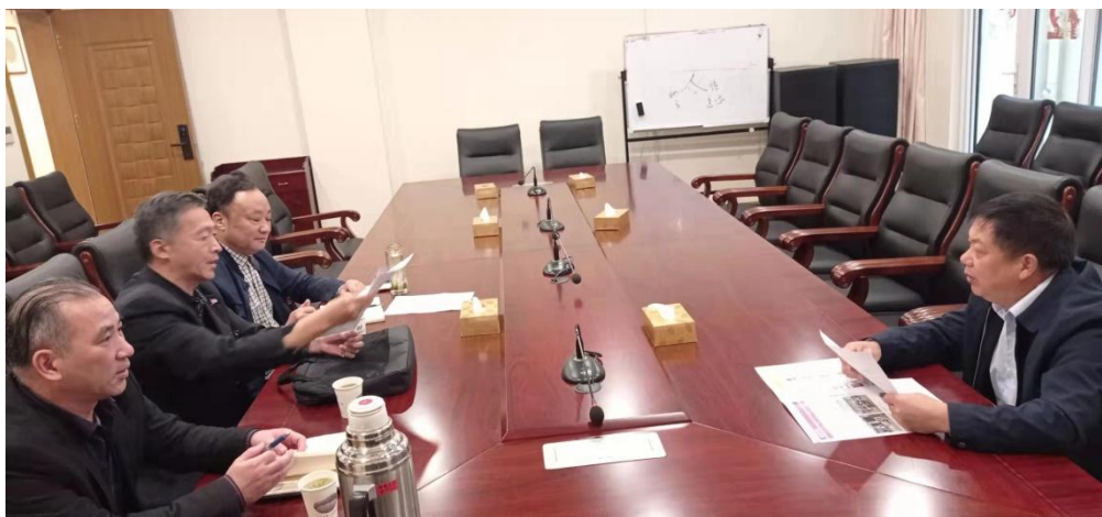
图 20 校领导走访企业

与杭州东度企业管理有限公司共建“浙江宇翔职业技术学院、杭州东度企业管理人才培养研究院”，联合开展为企业“订单式”培养科技应用技术技能人才，为企业解决缺乏技术人才难题。