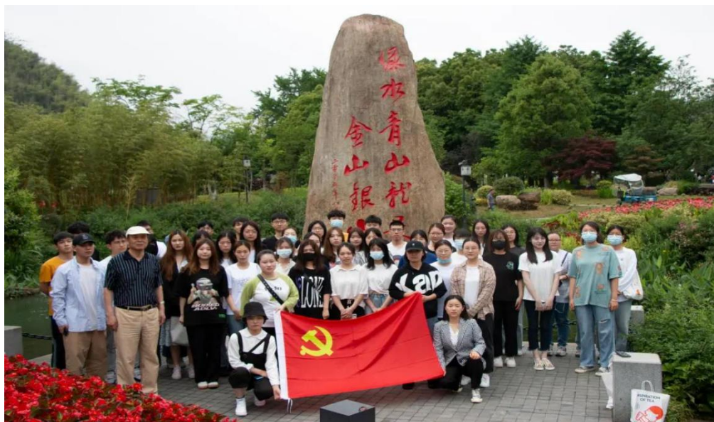
图 1 浙江宇翔职业技术学院学子实践学习

学院地处安吉，充分利用得天独厚的红色乡土资源，组织师生代表到两山理论诞生地——余村、浙北第一党支部——老石坎党支部、省级爱国主义教育基地——孝丰烈士陵园进行寻访学习。如在余村总书记在此发表了“绿水青山就是金山银山”的科学论段，作为治国理政理念已写入中国特色社会主义思想的基本方略第四条、第九条。师生们瞻仰纪念碑、参观文化广场、电影院、村史馆，重温入党誓词。大家看到的是“景美、富户、人和”，所受教育生动活泼，收获很大。