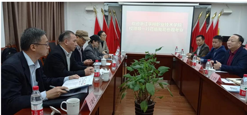
图 19 校领导与企业商谈订单班

于“工匠精神”的应用技术技能人才；与广汽集团共建“工业机器人智能制造中心”，开展基于“工业 4.0”应用的教育教学和科研运用。