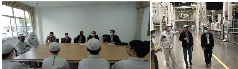
图 21 校领导看望订单班学生

研”合作创新模式。与企业签订合作协议，共同开展全方位的战略合作，合作重点在服务地方社会发展与教育事业发展、高素质应用技术技能人才培养、人员培训、应用性科学技术研究推广等。推进与企业开创了新一轮“工匠精神”的人才培养创新模式。