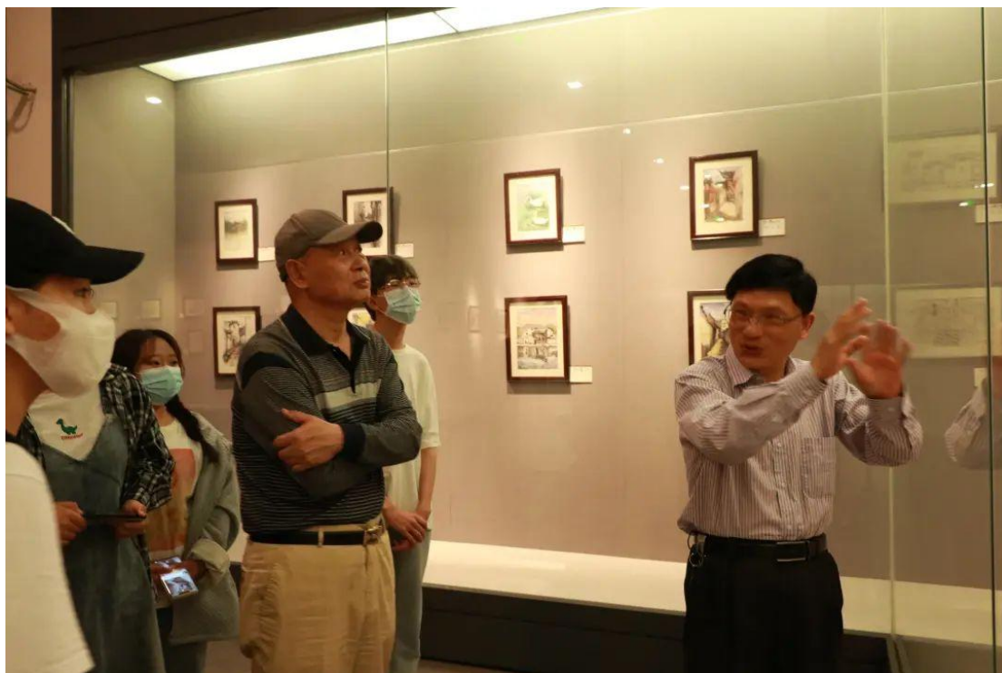
图 2“点亮红色青春·感悟传统文化”绘画展

与此同时，学院开展了“寻找身边的‘五四’”、“红色观影”、“我心向党，描绘红色百年历程”校园涂鸦、“追忆革命岁月，传承红色文化”歌咏比赛等形式多样的活动，弘扬社会正能量，丰富大学生课余时间，给学生提供展的舞台，进一步营造校园积极向上的氛围，激发广大学生的爱国情怀，树立正确的人生观、世界观和价值观。