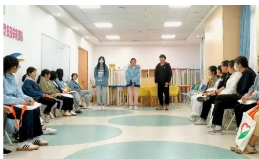
图 15 心理团辅训练营