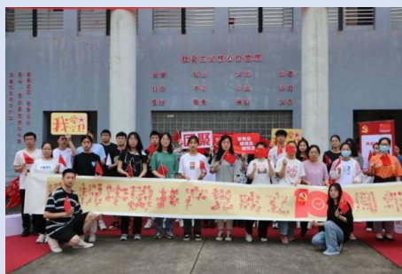
图 6 “传承红色基因，追寻红色之旅”活动

“传承红色基因，追寻红色之旅”，搭建沉浸式体验场馆，将历史事件的回顾与体验式解读相结合，进行艺术化处理，让广大师生通过寓教于乐的参与方式，再次感受我党的百年历程，厚植爱党、爱国、爱社会主义的情感，让红色基因、革命薪火代代传承。