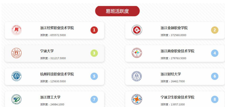
图 22 浙江省易班活跃度排行榜（2021年11月12日数据）