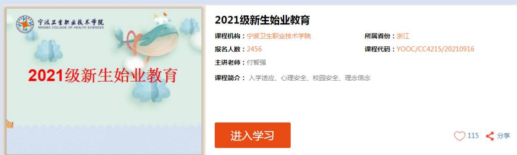
图 24 易班优课始业教育课程