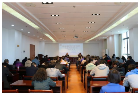
图 37 基层教学科研组织负责人聘任仪式