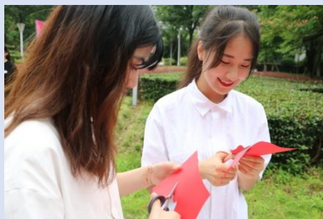
图 5 同学在剪纸

“非”凡匠心剪纸社的同学们和现场活动的同学们纷纷手持剪刀，认真剪刻红色“党”字，百名学生铸剪百张“党”字，庆祝“中国共产党成立 100 周年”。用一把剪刀，一张红纸，剪出了红色记忆，剪出了峥嵘岁月，剪出了辉煌诗篇。