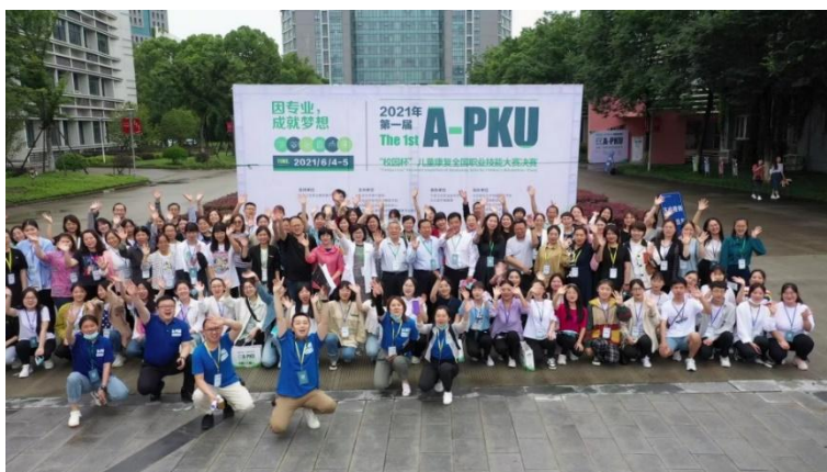
图 33 学校主办首届 A-PKU“校园杯”儿童康复全国职业技能大赛

5000 名选手参赛，经过初赛在线学习考试、复赛技能演练等多轮角逐，来自全国 30 个院校的 94 位同学进入决赛。学校精心准备，克服疫情等不方面的不利影响，与北大医疗脑健康公司一起顺利完成了决赛现场的组织工作。赛事对儿童康复专业人才培养及新兴儿童康复行业发展的推进作用得到了各方高度认可。