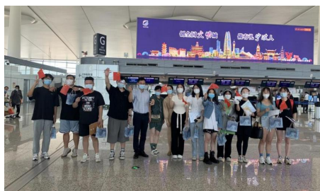
图 39 学校召开赴韩留学学生行前教育会 图 40 学校派领导到机场为赴韩学生送行