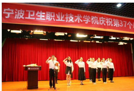
图 35 新教师宣誓（图左）