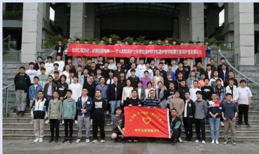
图 32 男护生发展论坛活动

近年来随着男护生人数逐年递增，如何着眼当下社会需求，以现状问题为导向，以男护生特点为抓手，以“校医共建”为契机，加强我校男护生的组织感、归属感，搭建一个相互交流、共同提高的发展平台，我校成立了宁波卫生职业技术学院“男护生联盟”，与宁波大学医学院附属医院“男护士联盟”“校医共建”，连续举办三届“男护生发展论坛”活动。邀请了宁波市护理学会理事长、宁大附院护理学科首席专家盛芝仁，宁波市护理重点学科、品牌学科“临床护理学”后备学科带头人、宁大附院副院长柳春波等专家学者做报告。未来，我们还将以“联盟”为依托，进一步加强交流合作，推进我校男护生专业实践育人迈上新的更高台阶。