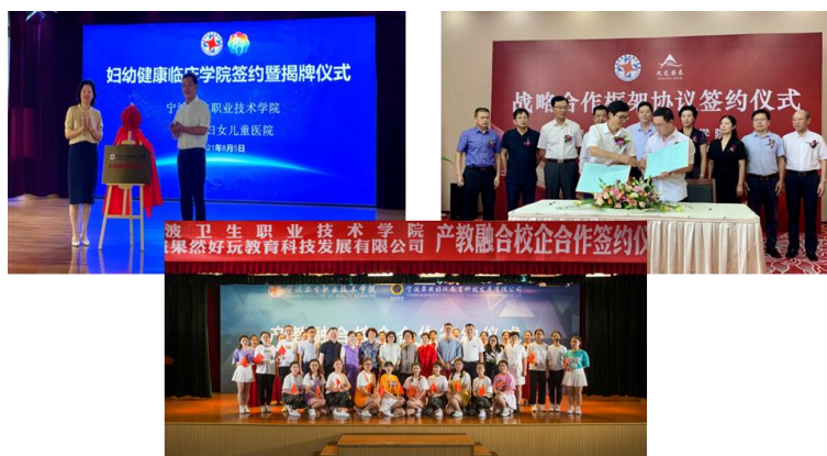
图 31 2021 年学校新成立产教融合育人平台

学校在新版人才培养方案的落实过程中，校企协同制定培养目标，强化岗位胜任力的人才培养，学校积极推进“工学交替教学、工作现场教学、项目化教学及理实一体教学”。2021年学校与21家紧密型合作基地机构合作，共同开发课程163门，开发教材23本。