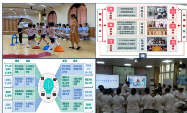
图 28 课程教学设计及教学实景

在2年建设经验的基础上，修订并出台《宁波卫生职业技术学院“活力课堂”建设指标》，进一步明确建设标准，精细过程管理，通过校级层面示范引领，二级学院全面推进，基本实现全校100%课堂建设全覆盖。2021年，对首批20门校级活力课堂建设项目进行验收，通过教学实施报告现场汇报、优秀教学案例评选、学生学习满意度测评、课程建设绩效指标验评等多主体多维度评价，最终共有17门课程通过验收，平均绩效达标率为82.86%，比计划70%高出12个百分点。通过活力课堂建设，切实增强教师教学成就感、学生学习获得感，全面提升师生双岗位胜任力，课程团队获省级各类课堂教学改革项目2项，省级一类教师教学能力竞赛4项，省级优秀教学案例7项。另外，第二批校级活力课堂建设工作已启动，至2023年，学校将完成60门院级活力课堂建设。