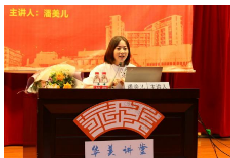
图 36 全国人大代表、第 42 届“南丁格尔奖”获得者作客华美讲堂（图右）