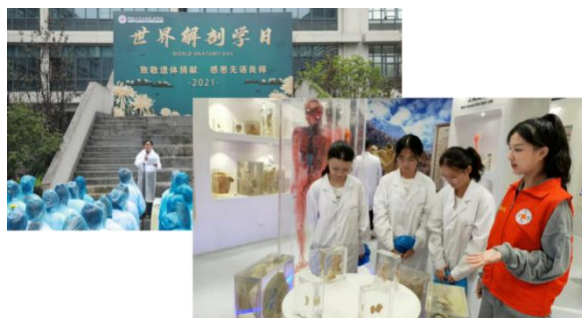
图 30 开展课程思政现场教学的情况