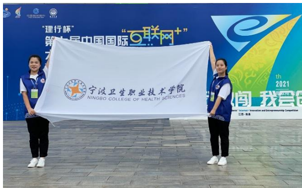
图 25 《爱撒无声—智慧康复助力 1500 万言语障碍儿童》项目团队在第七届中国国际“互联网+”大学生创新创业大赛中获得银奖