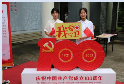
图 3 同学参加党史学习体验活动

为迎接中国共产党百年华诞，扎实开展党史学习教育，积极营造学党史的浓厚氛围，培养新时代青年爱国、爱党、爱家的家国情怀，学校在仁爱小广场开展“传承红色基因，追寻红色之旅”沉浸式党史学习体验活动。