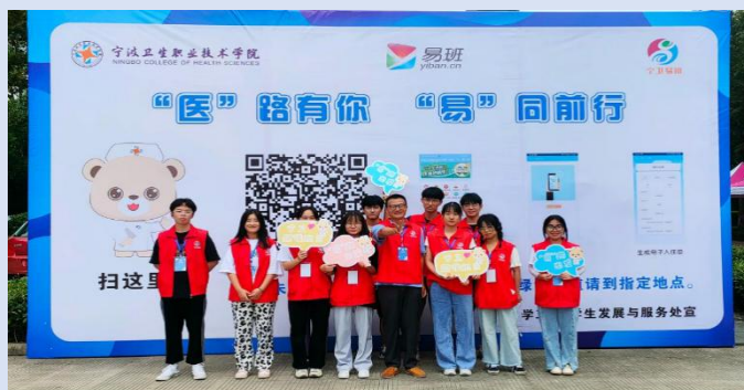
图 23 易班迎新现场

前通过易班进行健康打卡、登记报到行程、提交报到申请，为现场报到提供健康监测信息，确保疫情常态化背景下安全入学。报到现场通过易班扫码入校、签到、申请绿色通道，参与丰富多彩的线上线下活动。入学后通过优课进行网上始业教育、学校应知应会知识测试等活动。实现了易班主题全方位全过程贯穿迎新工作。学校易班迎新推文2次入选易班“今日头条”，学校易班迎新专题网站参与“易班网首届轻应用作品征集大赛”获优秀作品奖。