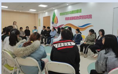
图 19 组织经济困难学生会开展心理团辅

二是助能扶智，打造核心素养培育“暖阳”工程。做实学业帮扶课堂、做强素质拓展课堂、做优心理健康课堂、做亮感恩教育课堂、做特公益服务课堂、做好优秀学子课堂。通过“六课堂”，建立集学习、心理、素质和能力一体化帮扶的核心素养提升体系，给予学生积极向上的“阳光”。