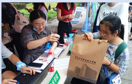
图 18 向“绿色通道”入学新生赠送励志礼包

一是精准扶贫，打造经济资助“暖春”工程。学校全面落实国家资助政策，通过家访、大数据分析和谈心谈话等方式，开展精准资助工作。组织“仁爱第一课”系列活动。建立起较为完善的国家资助、学校奖助、社会捐助多元化、全方位的资助体系，给予学生求学的“希望”。