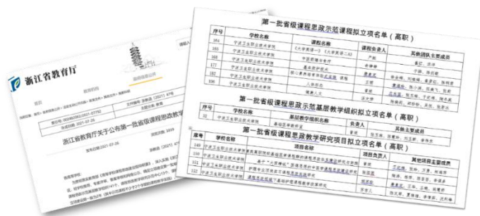
图 29 学校获批省级课程思政建设项目情况

2021年3月，学校在《宁波卫生职业技术学院进一步深化课程思政建设实施方案》的基础上，制定《宁波卫生职业技术学院课程思政建设五年行动方案（2021~2025年）》，进一步推进学校课程思政教育教学改革，强化课程育人功能，提升课程育人实效。学校成立课程思政教学研究中心，以加强对课程思政建设的重点、难点和前瞻性问题的研究，总结推广相关经验及做法，学校还邀请省内知名专家来校开展系列专题讲座，提升教师对课程思政的认识及建设水平。学校立项12门示范课程、8项教学研究项目及4个示范基层教学组织，进行重点建设。2021年，学校课程思政建设工作成效得以充分显现6门课程、4项教学研究项目及1个示范基层教学组织获省级立项，并获评省高教学会课程思政优秀微课2项、优秀案例1个、优秀学生征文3篇。