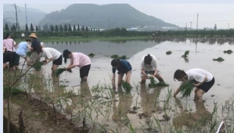
图 8 “爱心农田”种植水稻劳动实践