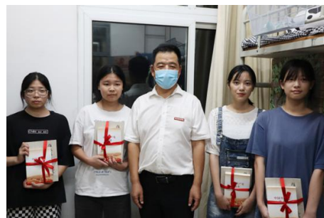
图 14 校领导看望经济困难新生