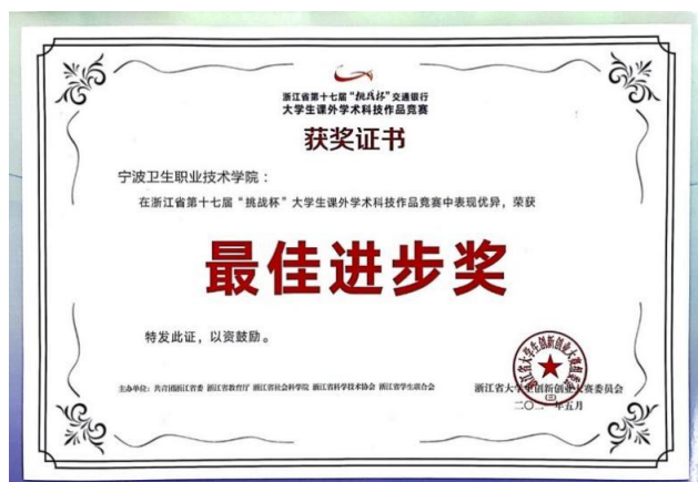
图 26 我校在浙江省第十七届“挑战杯”大学生课外学术作品竞赛中获得“最佳进步奖”