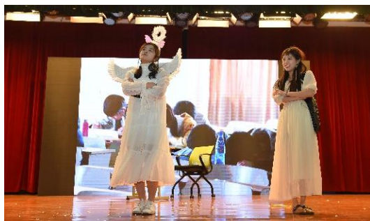
图 11 心理情景剧现场