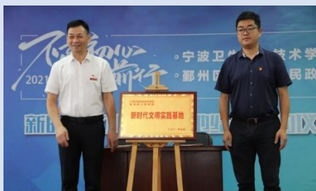
图 7 校地共建新时代文明实践基地签约

2021 年 6 月，学校与宁波市鄞州区瞻岐镇党委共建新时代文明实践基地，实现了劳动教育实践活动的“三多”：多元化的实践场所——劳动教育实践更接地气，多样化的实践内容——劳动教育实践更有灵气，多彩化的实践形式——劳动教育实践更聚人气。劳动场所遍布了瞻岐镇所辖 17 个行政村和 2 个社区，从田间到地头、从厂房到农场、从海边到山上。2021 年 6 月在瞻岐镇东二村认领的“爱心农田”种植的水稻，在当地农户的指导下，学生参与了耕田、起秧、运秧、插秧等劳动过程，经过 4 个月的生长，在 10 月份同学们下田收割，对水稻收割的全过程进行劳动实践体验。2021 年 7 月深入瞻岐镇养殖场、酿造厂、民宿企业进行采访，为乡村振兴进行采风宣传，通过网路直播带货，扩大了瞻岐镇“两菜一虾、两果一茶、两蟹一牛”的特色产品和“瞻岐小八鲜”品牌农业的知名度。通过校地共建“新时代文明实践基地”为载体，有关劳动实践教育相关的活动被中国教育新闻网、中国大学生在线、浙江在线、宁波日报等媒体报道。