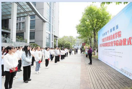
图 20 易班网络文化节

学校是浙江省易班试点建设高校，入选浙江省“三全育人”（网络育人）综合改革重点支持高校。学校网络育人工作以“共建、共享、共融”为理念，以易班建设为抓手，将易班建设成为有助于学生校园生活的一体化网络矩阵、有利于学生健康成长的网络思政教育综合平台，着力打造校园易班网络文化品牌。