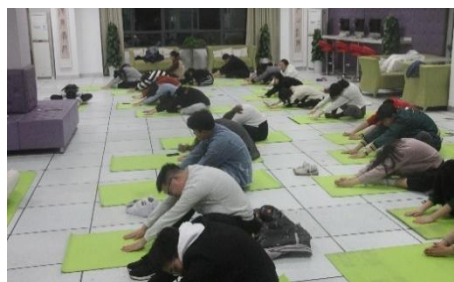
图 10 “正念减压”团体辅导现场