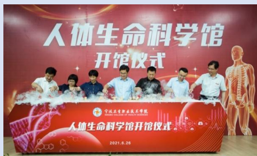
图 1 学校人体生命科学馆开馆仪式

本馆主要面向卫生健康专业的学生、教师以及医护专业人员开放，开展专业教学和专题研究。该馆将发挥现代化教学科研和智能化科普两个平台作用。既是实践教学、实习实训的重要场所，又是展示校情、宣传教育的生动课堂，还是传承红十字精神和志愿服务精神的阵地；为宁波增添了科普教育实践基地，促进提高民众医学科普知识、健康意识、预防保健意识和疾病防治意识等作用发挥。目前场馆面向本馆向社会公众、中小學生预约开放，接受社会参观，已经有 3000 余名人员来馆参观，获得较好的社会反响。