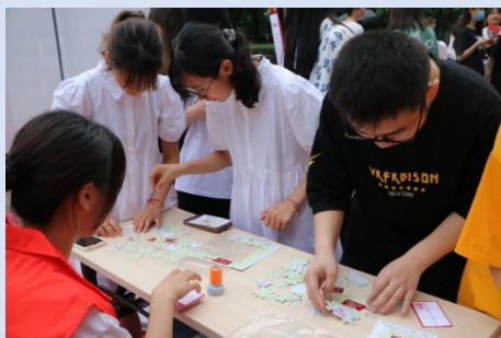
图 4 青年学子正在拼图