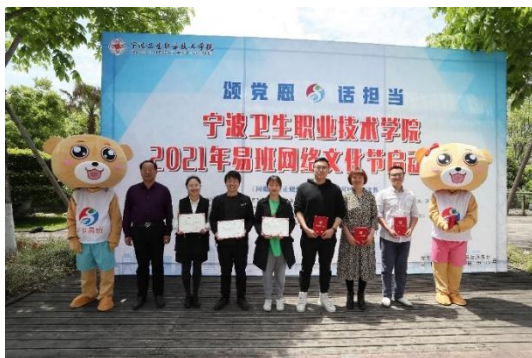
图 21 易班网络文化节

学校易班活跃指数长期位居省内前列。一年来，我校荣获全国易班共建高校优秀工作案例、“2021年易班优课大学生党史学习知识竞赛”优秀组织奖、浙江省优秀易班共建案例、浙江省优秀易班工作站、“易班网首届轻应用作品征集大赛”优秀作品奖、易班网第一届中国大学生简历大赛优秀组织奖三等奖等多项荣誉。易班学生工作站成员受邀公费参加教育部易班发展中心学生骨干培训。学校网络育人工作案例入选《浙江省高校“三全育人”综合改革理论与实践》丛书。