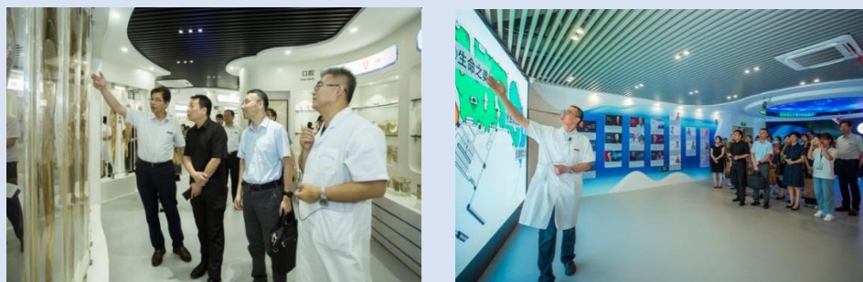
图 2 社会人员来校参观人体生命科学馆